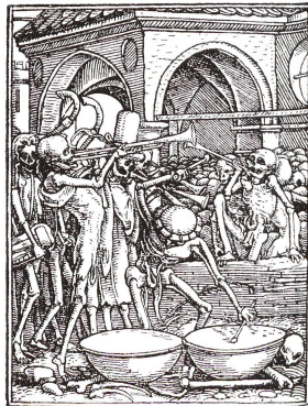
Hans Holbeins Beinhausmusik vermittelt zwischen den alttestamentlichen Szenen des Totentanzes und der Folge der Ständevertreter. Jahrhundertelang kopiert wurde der Trommler, der in kniender Haltung die doppelte Kesselpauke schlägt