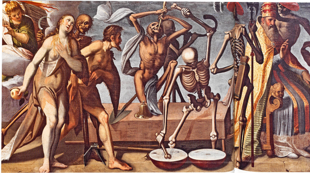
Die makabren Gemälde im Ritterschen Palast, Luzern, stammen womöglich aus zwei eng verwandten Totentänzen, denn nur sieben von acht Leinwänden lassen sich sinnvoll aneinanderfügen. Den Anfang der Szenenfolge macht die Vertreibung aus dem Paradies. Während die Skelette gerade so wie bei Hans Holbein musizieren, bekennt sich Eva schuldig für den Sündenfall. Adams zukünftige Arbeit deuten Hacke und Schaufel an. Mehrheitlich geht man davon aus, dass Jakob von Wyl das Werk um 1610/15 für den Luzerner Jesuitenkonvent malte. Ein paar Jahre später wird ein Totentanz im Franziskanerkloster erwähnt