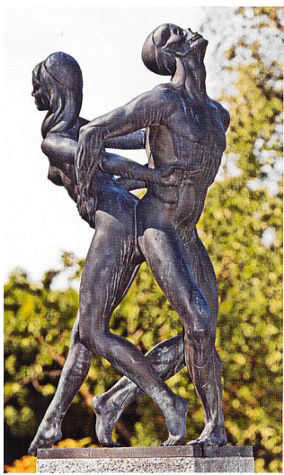
Der Stäfner Totentanz von Hans Jörg Limbach weist durchaus erotische Qualitäten auf: Zwei nackte Körper haben sich lustvoll zum Tanz vereint. Doch der stolz erhobene Schädel des Mannes lässt keinen Zweifel aufkommen, dass die beiden sich vom Diesseits ins Jenseits bewegen (siehe S.86)

Vertreter unterschiedlichen Alters und beiden Geschlechts treten wiederum separat an, wobei eine Nonne den Zug der Frauen anführt.