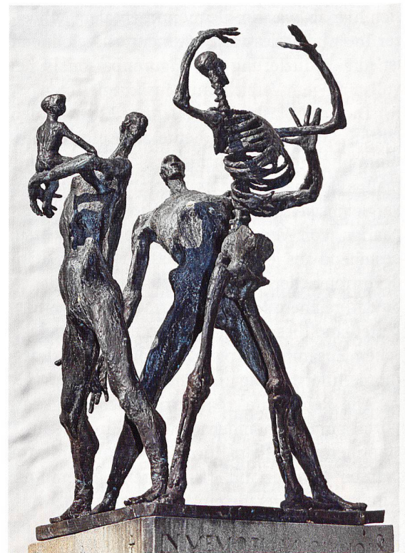
Totentanz von Josef Nauer in Lachen SZ

Ganz anders geartet ist der Totentanz von Schang Hutter auf dem 1994 eingeweihten Friedhof von Bern-Bümpliz. Das aus Eisenplastiken und Betonreliefs bestehende Ensemble gehört zu den originellsten Versuchen, den klassischen Totentanz wieder in die Sepulkralkultur zu integrieren. Die von den Architekten Ueli Schweizer und Walter Hunziker entworfene Anlage gaukelt keine Idylle vor: Rostige Eisenköpfe mit spitzen Nasen begrüssen den Besucher. Urnennischen säumen den Weg, der zu einem Ruheplatz mit geschwärzten Holzpfehlern führt. Erst auf den zweiten Blick erkennt man, dass die daran angebrachten farblosen Figuren Leichen darstellen, ausgemergelte, in der Erde versunkene Körper im Zustand der Verwesung. Und nur wer sich Zeit nimmt, die eingeritzten Inschriften zu entziffern, entdeckt heitere und besinnliche Texte von Dichtern wie Bettina von Arnim, Peter Bichsel, Rainer Brambach, Erich Fried, Friedrich Hölderlin, Ernst Jandl oder aber Dialogverse aus dem oberdeutschen Totentanz: «Herbeigehinkt, mit deiner Krücke, | der Tod reisst dich jetzt nieder. | Der Welt hast du nicht viel gegolten, | komm her, an meinen Tanz.» ●