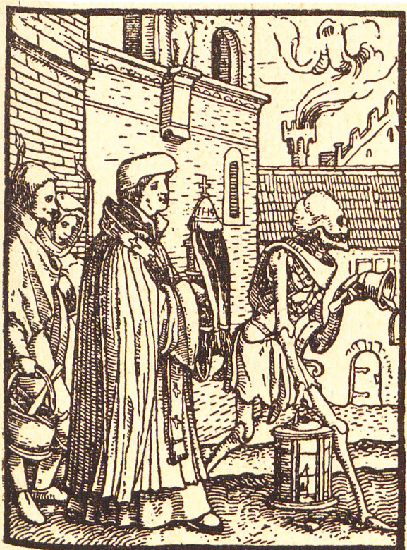
1524/26 entwarf Hans Holbein in Basel eine Szene, die international und interkonfessionell Verbreitung fand: Ein skelettierter Ministrant begleitet den Pfarrer beim Versehgang. Die beiden sind unterwegs, um einem Sterbenden die Beichte abzunehmen und schliesslich die letzte Kommunion zu reichen