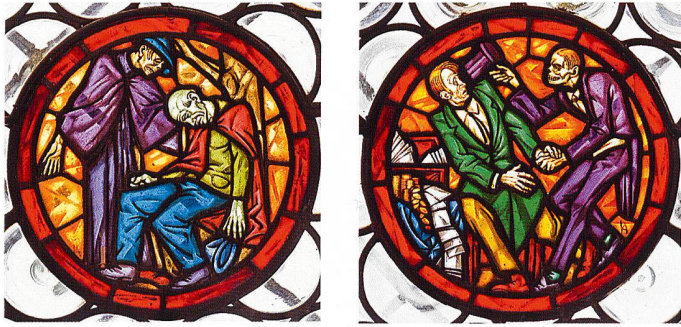
Die Glasmalereien, die Hans Lothar Albert 1924 für die Totenkapelle in Schwyz schuf, sind noch fest im christlichen Weltbild verankert. Im zugehörigen Text lässt er den armen Alten sagen, Sterben falle ihm leicht, da er im Leben nichts gehabt habe als «Müh und Plag». Der reiche Herr erkennt dagegen, dass er nun im Angesicht des Todes mit leeren Händen dasteht