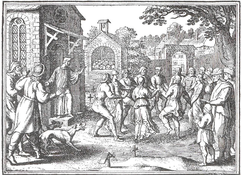
Matthaeus Merian stach für Johann Ludwig Gottfrieds Historische Chronik ein Ereignis in Kupfer, das sich im Jahr 1012 in Kölbzig zugetragen haben soll: Ein Pfarrer unterbrach die Messe, um Männer und Frauen vom Tanz auf dem Friedhof abzuhalten. Der Sage nach missachteten sie sein Gebot und büssten dafür mit Krankheit und Tod

Wenig später entstanden vergleichbare Werke in ganz Europa: 1424/25 in Paris, um 1440 in Basel und Ulm, schliesslich von Spanien über das Elsass bis ins Baltikum. Nur die wenigsten sind erhalten. Ursprünglich eröffnete ein Prediger die Reihe, später auch ein oder mehrere musizierende Gerippe. Einander abwechselnd treten danach mumienartige Skelettgestalten und Todgeweihte in hierarchischer Folge auf. In der klassisch gewordenen Form spricht der Tod den Lebenden an, der antwortend sein Schicksal beklagt.