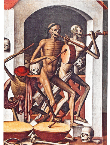
Das Hochformat im Luzerner Regierungspalast kopiert ziemlich genau die Beinhausmusik aus Matthäus Merians Kupferstichfolge zum Basler Totentanz. Den Trommler vorn links hat der Maler dagegen Hans Holbeins Bildern entlehnt: Die Kappe stimmt überein; bloss das aus der Bauchhöhle baumelnde Gedärm fehlt

Im Barock entstanden Neuschöpfungen – in der graphischen Kunst – vor allem wohl auf Initiative von Bruderschaften. Dabei handelt es sich um eine nördlich der Alpen heute kaum noch bekannte Form der jenseitsvorsorge: Laien und Geistliche organisierten sich, um systematisch der Toten zu gedenken, damit das eigene Seelenheil zu sichern sowie das Schicksal der Verstorbenen im Fegefeuer zu lindern. Später verschob sich der Schwerpunkt auf den Bereich der Sterbe- und Begräbnisbegleitung. Das schönste Schweizer Beispiel für das praktische Wirken einer solchen Vereinigung befindet sich Poschiavo GR. In der Loggia des 1732 wiedererbauten Oratorio di Sant'Anna ruhen – für Passanten bis heute sichtbar – die bei der Neubelegung von Gräbern gefundenen Schädel in langen Reihen auf Gestellen, die makabre Bilder und Bibelverse zieren. An den Wänden hängende Bahnen beweisen, dass die Toten ebenfalls dort ausgestellt wurden. ▶