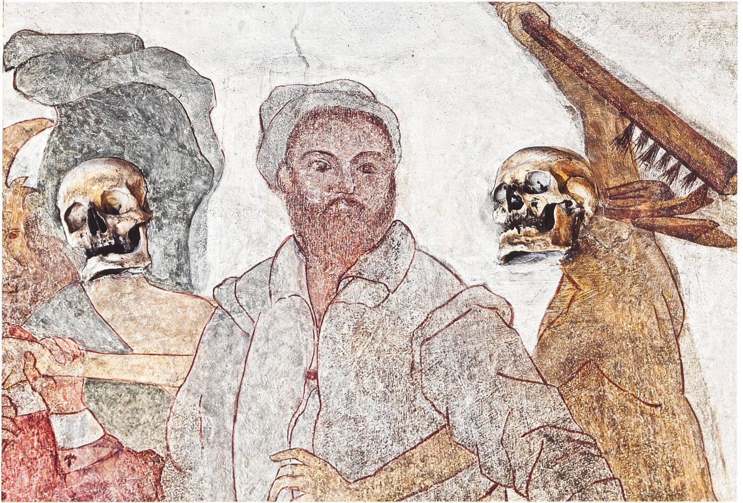
Was die makabren Wandmalereien in Wolhusen von vergleichbaren Werken unterscheidet, sind echte, in den Verputz eingefügte Totenköpfe. Die Detailaufnahme des sterbenden Bäckers beweist, dass der namentlich nicht bekannte Künstler und die Handwerker eng zusammenarbeiteten, um die Schädel perspektivisch genau anzubringen