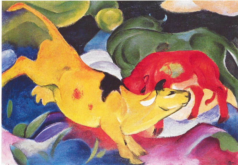
The Yellow Cow, Franz Marc 1911

Eine Reise zum geographischen Epizentrum der Moderne