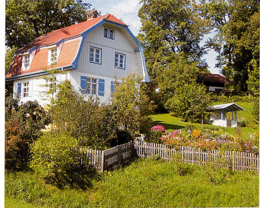
Münter-Haus in Murnau

mindestens 12, maximal 25 Personen. Melden Sie sich für diese Reise mit dem Bestelltalon am Ende des Hefts, per Telefon 031 308 38 38 oder per E-Mail an: gsk@gsk.ch