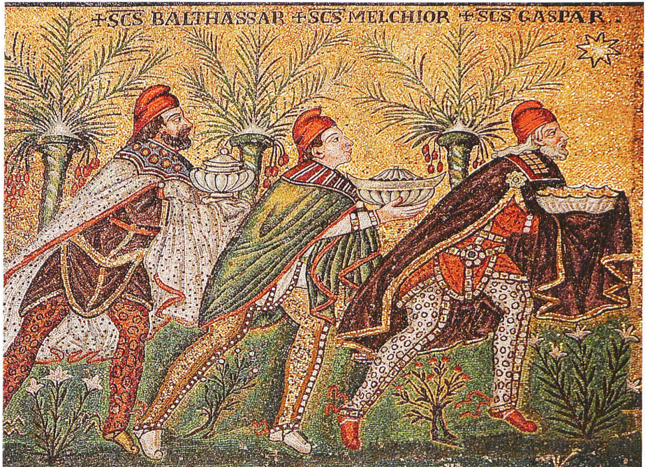
Sant'Apollinare in Classe

IGA Archäologie Konservierung Giesshübelstrasse 62i, 8045 Zürich