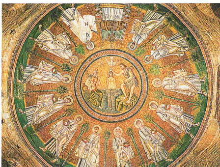
Kuppelmosaik in Ravenna

Es war einmal in Italien: Da herrschten hier Germanenkönige und prägten für Jahrhunderte das politische und künstlerische Leben speziell am Po und an der Adria. In ihrer letzten Hauptstadt Ravenna liessen die Ostgoten unter Theoderich im späten 5. Jh. mit Dom, Baptisterium und Grabmal die schon verlorene geglaubte römische Pracht aufleben; das Mausoleum der Galla Placidia galt ihnen als ehrfürchtige Inspirationsquelle. Die Byzantiner unter Belisar beendeten gewaltsam die germanische Epoche, aber was sie hinterliessen – San Vitale und San Apollinare in Classe –, gehört mit der atemberaubenden Architektur und den betörenden Mosaiken zum Eindrucksvollsten jenseits der Hagia Sophia. Doch ihnen erwuchs schon bald ein stärkerer Gegner: Die so vielfältig begabten Langobarden erkämpften sich seit dem 6. Jh. mit der Hauptstadt Pavia die Herrschaft und prägten für 200 Jahre die Kunstentwicklung Oberitaliens bis in die Romanik hinein. Der Name Lombardei weist klingend auf eine Epoche zurück, die «das dunkle Zeitalter» genannt wird und doch einen Reigen strahlender Glanzpunkte gesetzt hat.