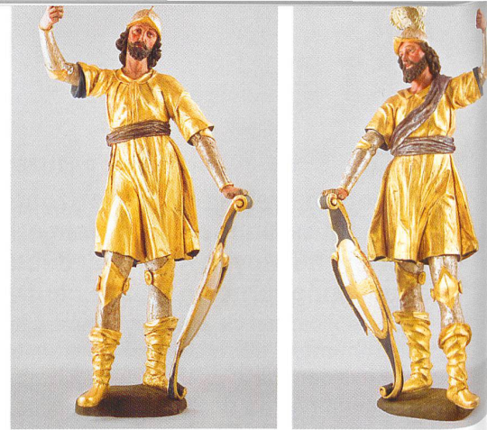
Solothurn, Kapelle St. Peter , Skulpturen der Heiligen Urs und Viktor (Standort seit 2009: Kapelle St. Martin in Rüttenen). In der Kapelle St. Peter finden sich besonders viele Ausstattungsteile, die der Verehrung der Stadtheiligen Urs und Viktor dienen. Die Legionäre aus der Thebäis wurden der Legende nach als Christen verfolgt und in Solothurn als Märtyrer geköpft und begraben. In den beiden aus Holz geschnitzten und reichvergoldeten Statuen sind Urs (l.) und Viktor (r.) aus dem 17. Jahrhundert mit Helm und Rüstung, Schild und (verlorener) Lanze dargestellt. Die ausdrucksvollen Gesichter und ausgreifenden Gebärden weisen auf einen begabten und fähigen Bildhauer hin, der bisher nicht identifiziert werden konnte

Die Stadt Solothurn besitzt einen reichen Bestand an sakralen Baudenkmalern, die grösstenteils aus der Zeit des 17. und 18. sowie des ausgehenden 19. und der ersten Hälfte des 20. Jahrhunderts stammen. Ihre Anfänge reichen jedoch mit der ehemaligen Kapelle St. Stephan, der St.-Ursen-Kirche und