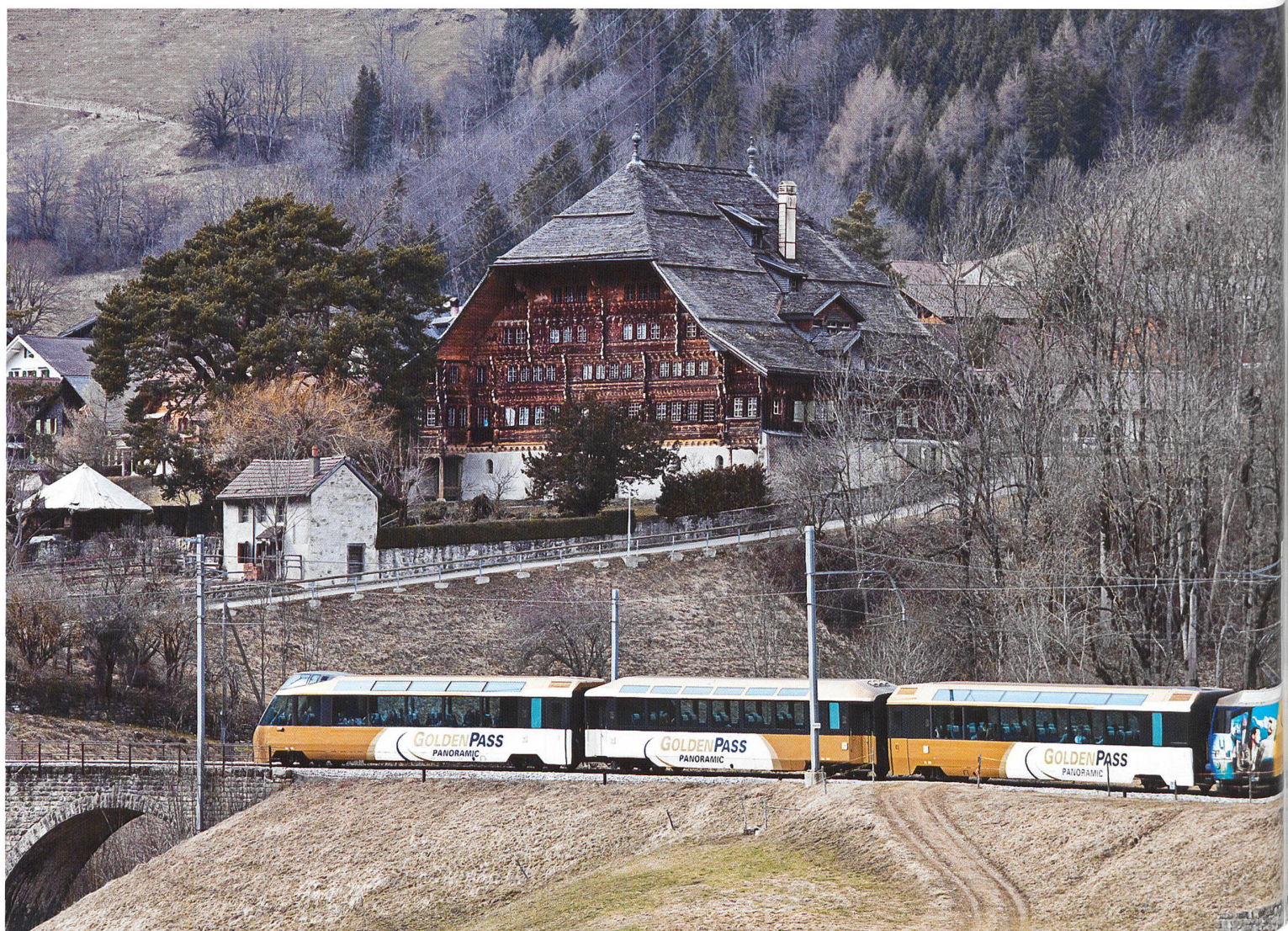
Rossinière: La Grande Maison, 1754, avec sa toiture en tavillons vue du sud-est

elle semble rivaliser avec les bâtiments publics. Pourtant, elle reste en lien avec la vie paysanne et la tradition des charpentiers du Pays-d'Enhaut.