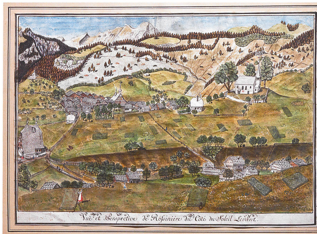
Rossinière: vue de l'est vers 1780, aquarelle d'Abram-David Pilet (Musée du Vieux Pays-d'Enhaut, Château-d'Œx)

Rougemont, Château-d'Œx et Rossinière ont appartenu au Comté de Gruyère jusqu'en 1555, puis ont fait partie du baillage bernois de Gessenay jusqu'en 1798. Ensuite, le Pays-d'Enhaut francophone forme un district vaudois.