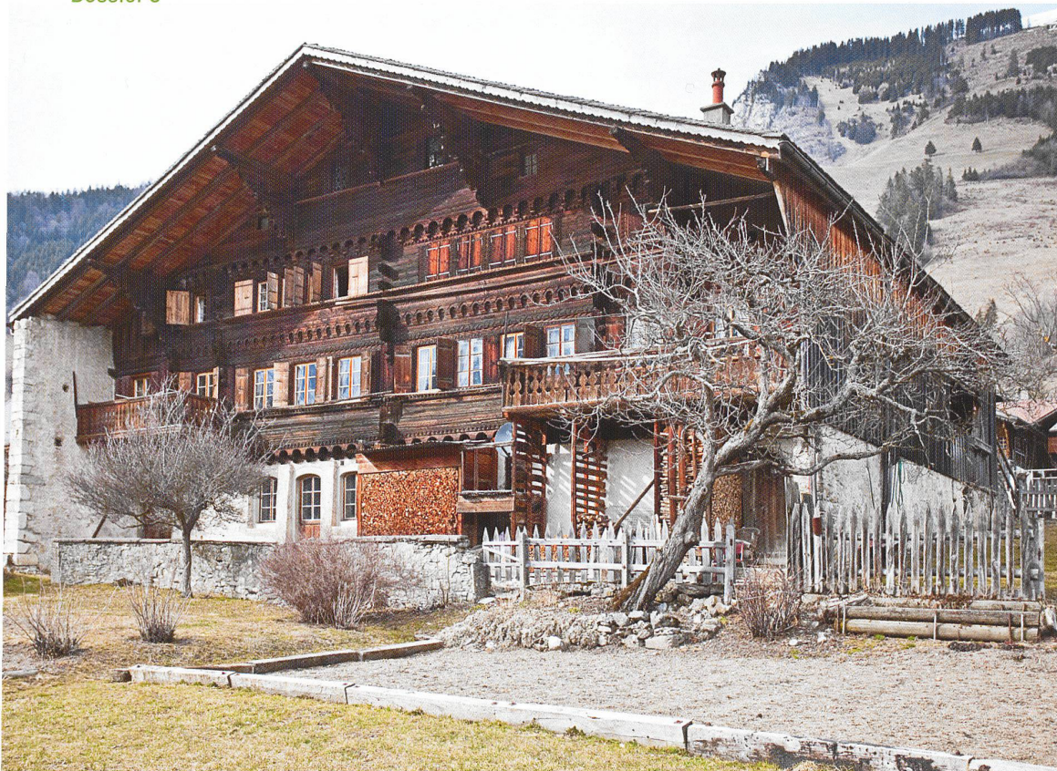
Rossinière: La Maison de la Place, 1664