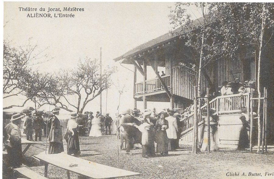
Le Théâtre du Jorat: public affluant à une représentation de la pièce «Aliénor», créée en 1910

A l'origine, Morax souhaitait bâtir son théâtre à Morges, sa ville natale et celle de ses débuts. Suite au peu d'encouragements qu'il y trouva, toutefois, il opta pour Mézières où le succès remporté en 1903 par sa pièce «La Dîme» lui avait valu d'excellentes relations. Outre les conditions intéressantes dont il pouvait y bénéficier, le fait que la localité fût desservie par la ligne Lau-