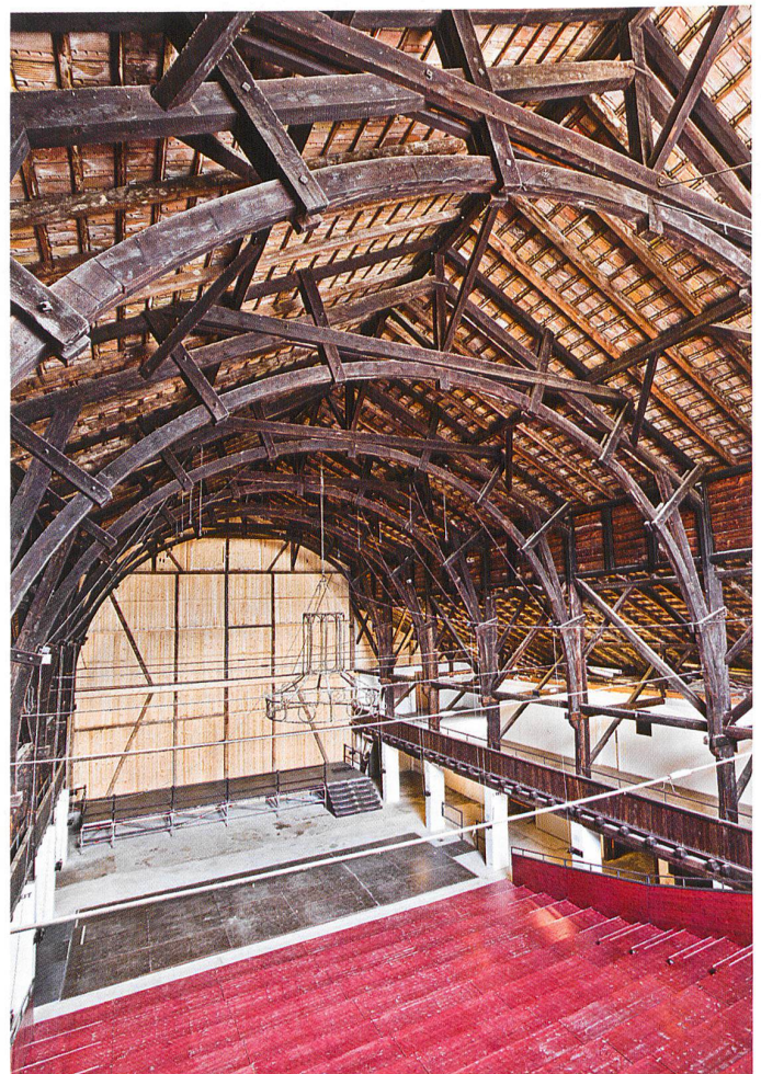
La salle et ses nouveaux aménagements scéniques: au premier plan, les gradins démontables; au sol, le plancher amovible recouvrant la fosse d'orchestre dans laquelle sont rangés les éléments de la scène

Markthalle, Kirche, Scheune: Mit dem Grundriss einer Basilika, den weiten Dachflächen und seinen beiden von Zelt-dächern bedeckten Türmchen weckt der Schiessstand von Moutier verschiedenste Assoziationen.