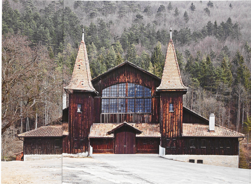
Le Stand de Moutier: une silhouette reconnaissable entre toutes

Als Besonderheit vereinigte der 1905 erbaute «Stand» von Moutier von Anfang an so unterschiedliche Funktionen wie die eines Schiessstands und eines Festsaaals.