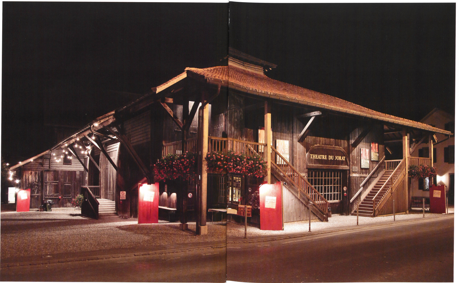
Ambiance nocturne: l'entrée du théâtre avec ses deux volées d'escaliers symétriques et ses balcons protégés par les vastes avant-toits