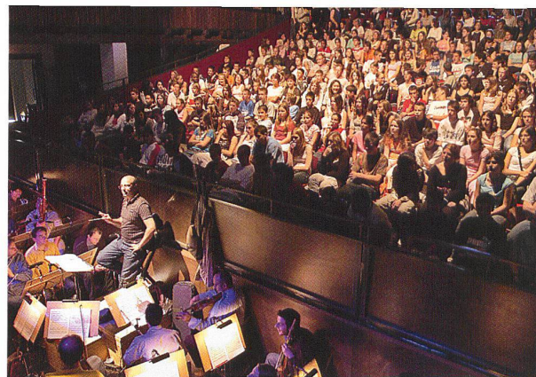
... et représentation de la «Flûte enchantée» lors du festival Stand'été 2005

L'élaboration des plans du nouveau Stand fut confiée à l'architecte Charles Kleiber (1875–1937), alors âgé d'à peine trente ans. Né à Benken, dans le canton de Bâle-Campagne, celui-ci avait effectué un apprentissage de dessinateur dans un bureau d'architecture bâlois puis obtenu un diplôme à la Technische Hochschule de Munich. Avant d'entamer sa formation professionnelle, Kleiber avait accompli sa dernière année scolaire à Moutier dans le cadre d'un échange linguistique. C'est ce qui explique qu'en 1898, alors qu'il était de retour à Bâle après ses études munichoises, le jeune architecte fut sollicité par