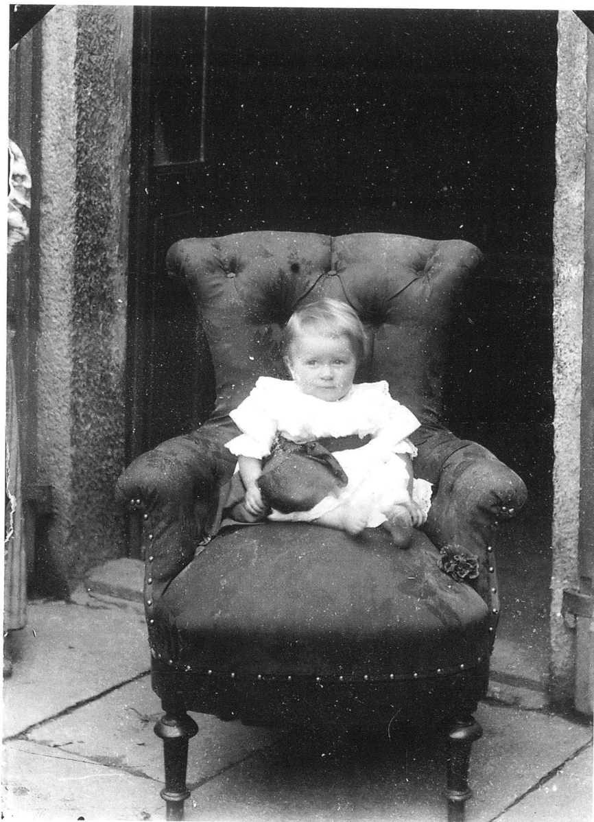
3 Roberto Donetta, Ritratto infantile.