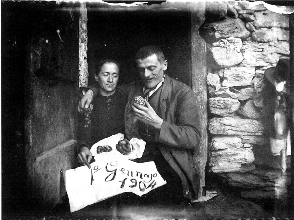
2 Roberto Donetta, Autoritratto con la moglie.