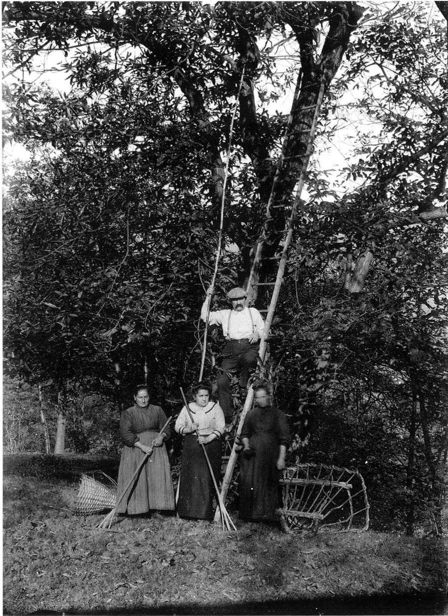
5 Roberto Donetta, Raccolta di castagne.