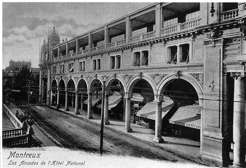
1 La galerie de l'Hôtel National à Montreux (1895–1896), dont la typologie est unique dans la région.