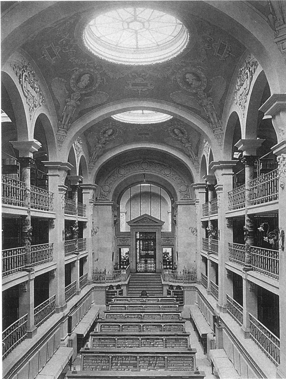
6 Lausanne, Palais de Rumine. – Vue intérieure de la «grande salle» de la bibliothèque (état des lieux lors de l'inauguration en 1906, altéré en 1955, date à laquelle une dalle intermédiaire est venue tronquer cet espace au niveau de la première galerie). La disposition panoptique primitive, permettant d'embrasser d'un seul regard les rayonnages de livres et les collections numismatiques et sigillaires, était surdéterminée par la recherche d'un effet de sublime, de vertige face à une multiplicité innombrable.