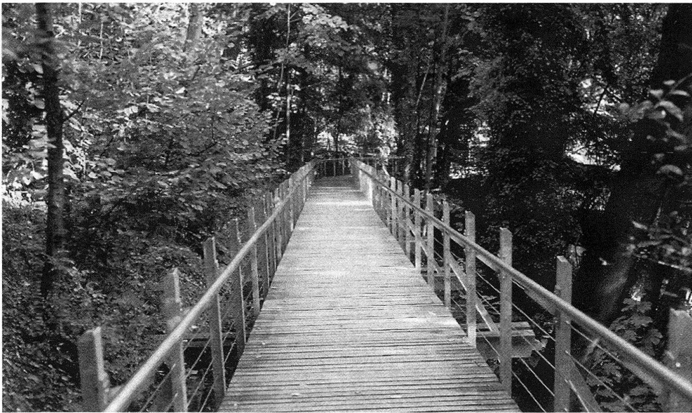
5 Der neu erstellte Zugang: der Steg zur Breite.

Zwischen Villenplatz und Sitzplatz wurde der Hangkante entlang ein wegbegleitender Strauchgürtel, dem englischen «belt» entsprechend, gepflanzt. Er verhindert auch den Abstieg in den Wald und macht den Waldsaum pflanzensoziologisch reichhaltiger.