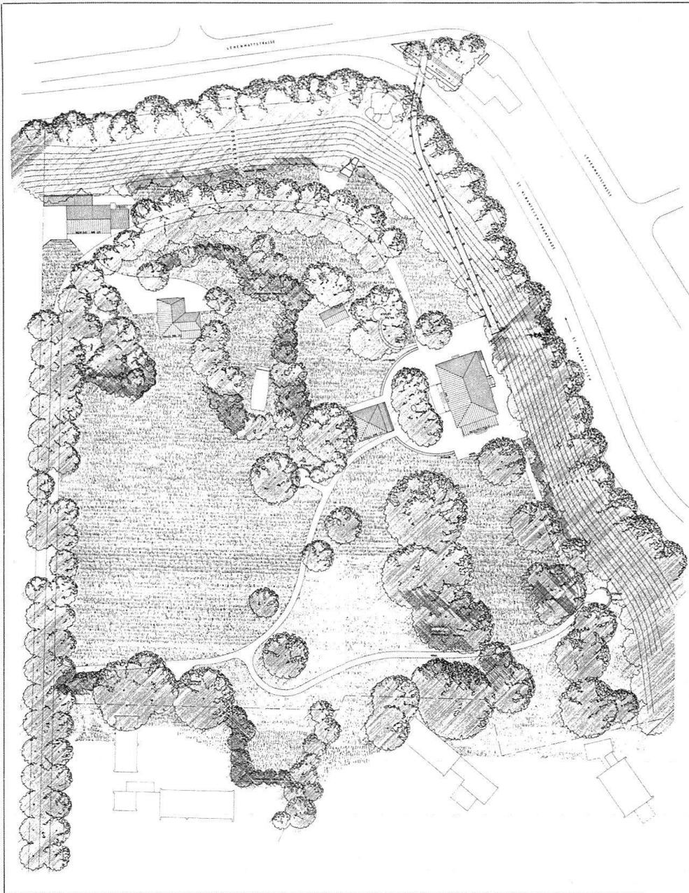
3 Der Projektplan der Landschaftsarchitekten von 1990.

Neues altes Zentrum sollte das heute als Musikschule genutzte Landhaus aus dem Jahr 1830 werden. Diese Zentrumsfunktion sollte durch die Wegführung, insbesondere durch die neue Fussgängerverbindung zur Breite unterstrichen werden.