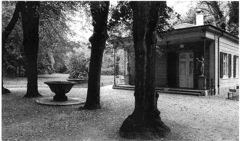
4 Auf dem Platz zwischen Musikschule und Pavillon, in Richtung Süden blickend.

sämlinge, die die ursprünglich dichten Baumgruppen jetzt als lockeres Nebeneinander von Stämmen erscheinen liessen, wurden entfernt. In diesen der englischen Landschaftsgartenidee entsprechenden «clumps» wurden Sträucher gesetzt. Das Wechselspiel von weiten und engen Räumen war wieder initiiert. Der eingeleitete Prozess wird – bei entsprechender Pflege und Aufsicht – innert weniger Jahre die beabsichtigte Wirkung wieder deutlich werden lassen. Zur Verjüngung des etwas überalterten Solitärbaumbestandes wurden wenige neue Bäume gezielt gepflanzt. Auf intensiver gestaltete Rabatten wurde, getreu dem historischen Vorbild, verzichtet 6 . Im Gegenteil. Bei der heutigen Musikschule wurden die in neuerer Zeit entstandenen Blumenbeete und Heckenabschnitte entfernt. Die Villa steht heute wieder auf einem Mergelplatz, dessen Form und Ausdehnung schon auf dem Hämmerlin-Plan erkennbar sind. Demgegenüber neu ist allerdings die Führung des auf den Platz laufenden Hauptwegs. Bedingt durch die Umnutzung wurde die ehemalige Hintertür des Landhauses zum Haupteingang der Musikschule. Eine Rekonstruktion der Wegführung in diesem Teil wurde auch aus Gründen der Verhältnismässigkeit abgelehnt. Hingegen schliesst das neue Rundwegnetz am Ostrand des Platzes an die alte Vorderseite des Hauses an.