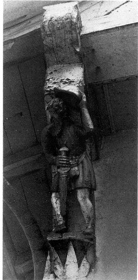
Abb. 4. Zürich. Spiegelgasse 2, «Zum oberen Spiegel». Das Haus ist mit einem Krüppelwalm gedeckt. Die Büge des nach Nordosten vortretenden Giebels sind mit drei geschnitzten und polychrom gefassten Figuren geschmückt. Die linke davon zeigt den mit einem Schwert bewaffneten Mann, der den Hut lüftet, über dem Wappen Wüst (1566)