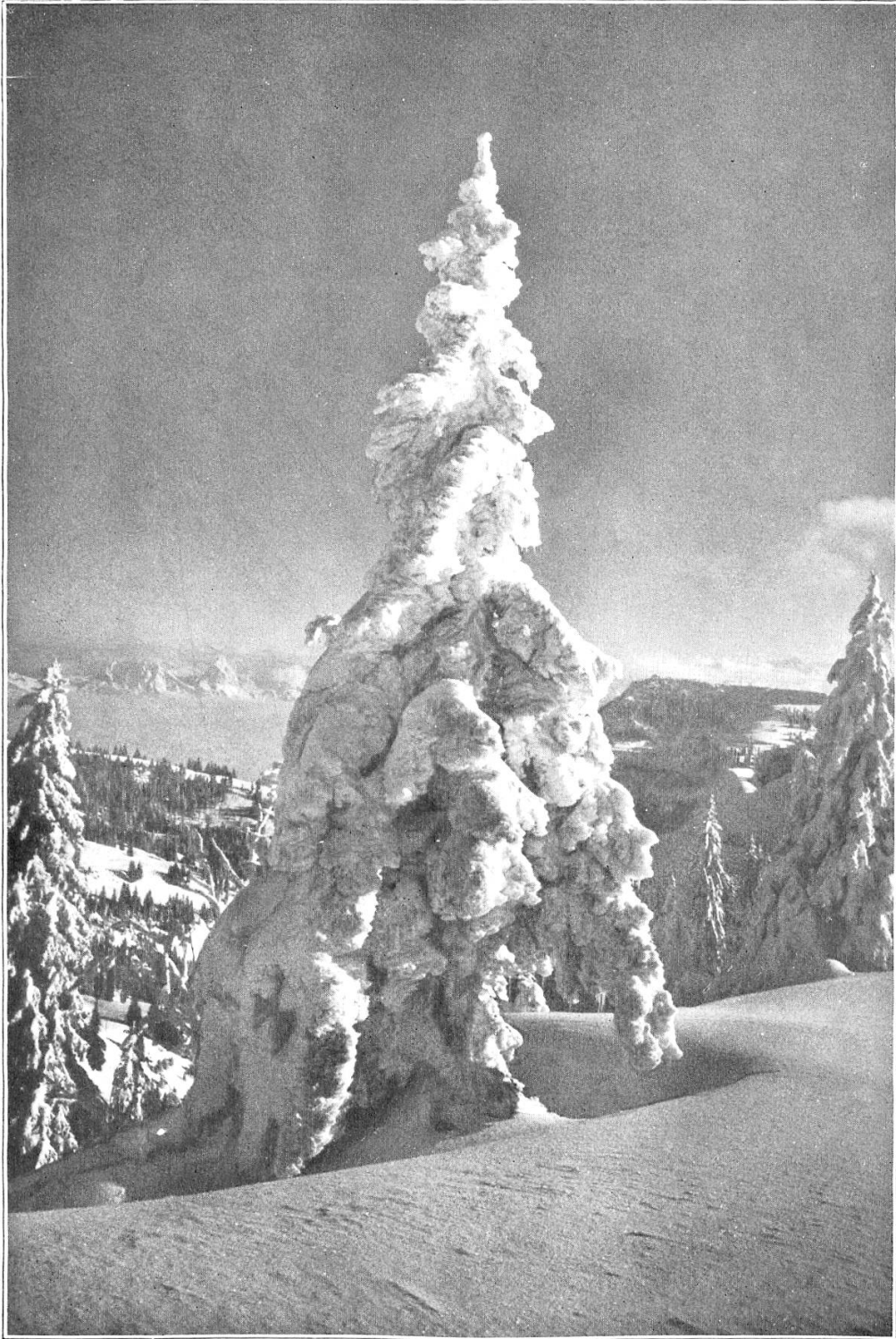
Schneespiess und —