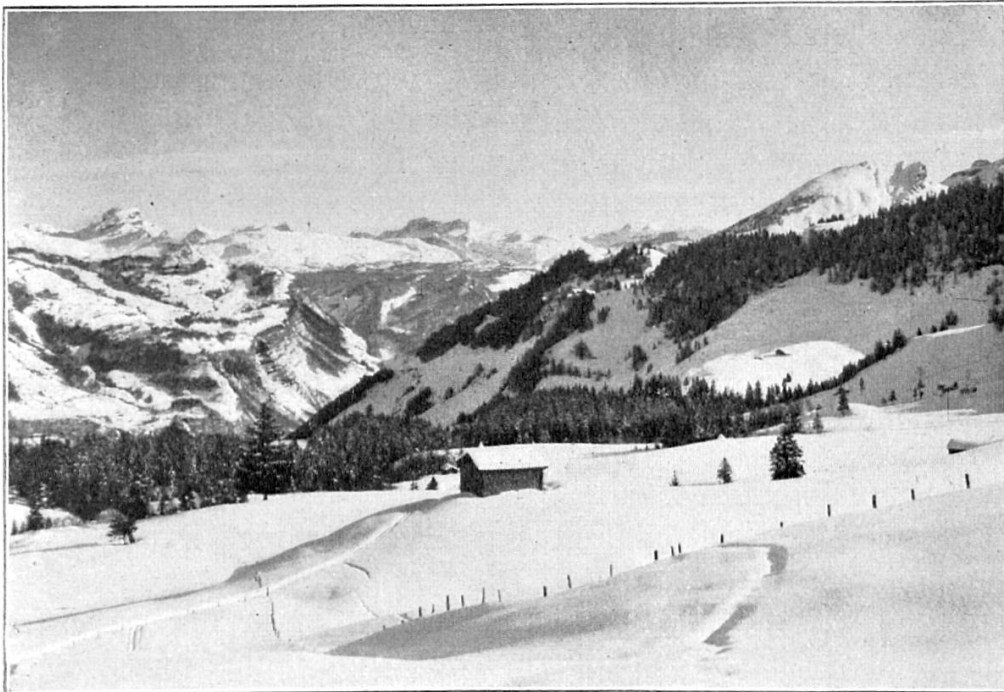
Blick vom Stoss ins Muottatal

In langen Zickzack führt die Route über die Alpen Wellesch, Bödmern und Oberfeld in etwa 1½ Stunden zur Spitze, auf der sich ein Bild von überwältigender Pracht dem Auge