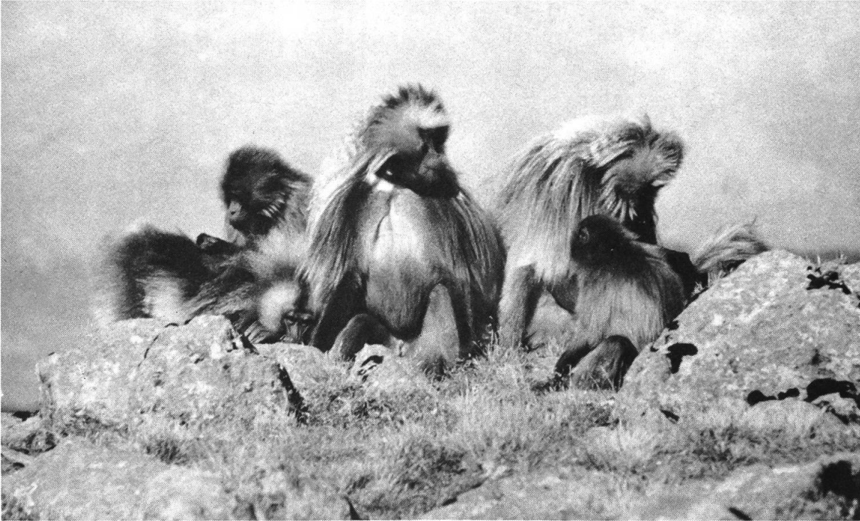
Abbildung 7: Männergruppe von Gelada-Pavianen an der Hochlandkante – das zutraulichste Wildtier Semiens, über dessen soziales und ökologisches Verhalten viele Forschungsarbeiten gemacht worden sind. H. Graf, Okt. 1975 bei Gich Camp