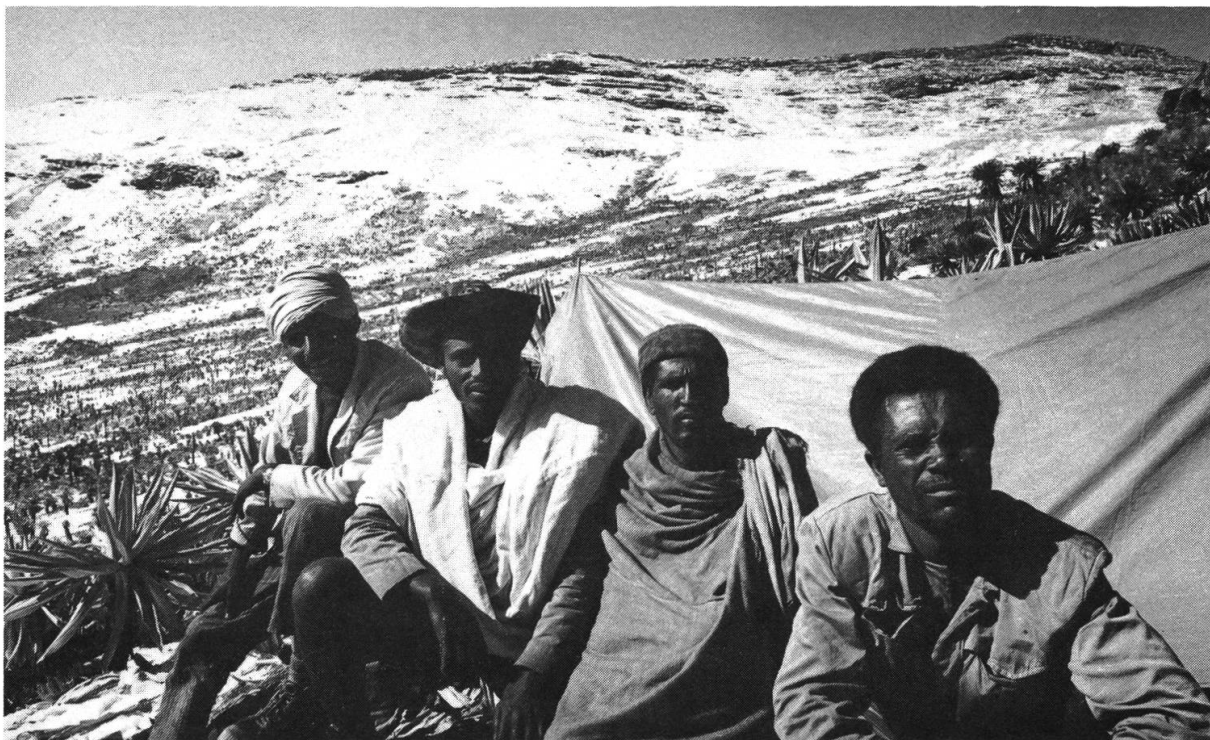
Abbildung 4: An Strapazen gewohnte Führer, Wildhüter und Maultiertreiber schrecken auch vor einigen Tagen mit gelegentlichem Schnee auf den Gipfeln nicht zurück und sind für das Gelingen eines Treks unersetzbar. H. Hurni, 14. Feb. 1976