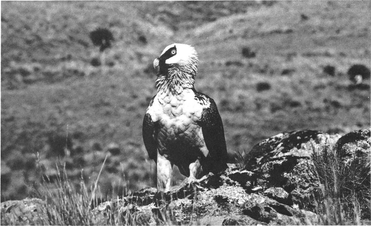
Abbildung 9: Der Lämmer- oder Bartgeier ( Gypaetus barbatus ) ist der eindrucklichste Raubvogel Seimiens mit über 2 m Flügelspannweite. H. Hurni, Okt. 1974 in Gich Camp