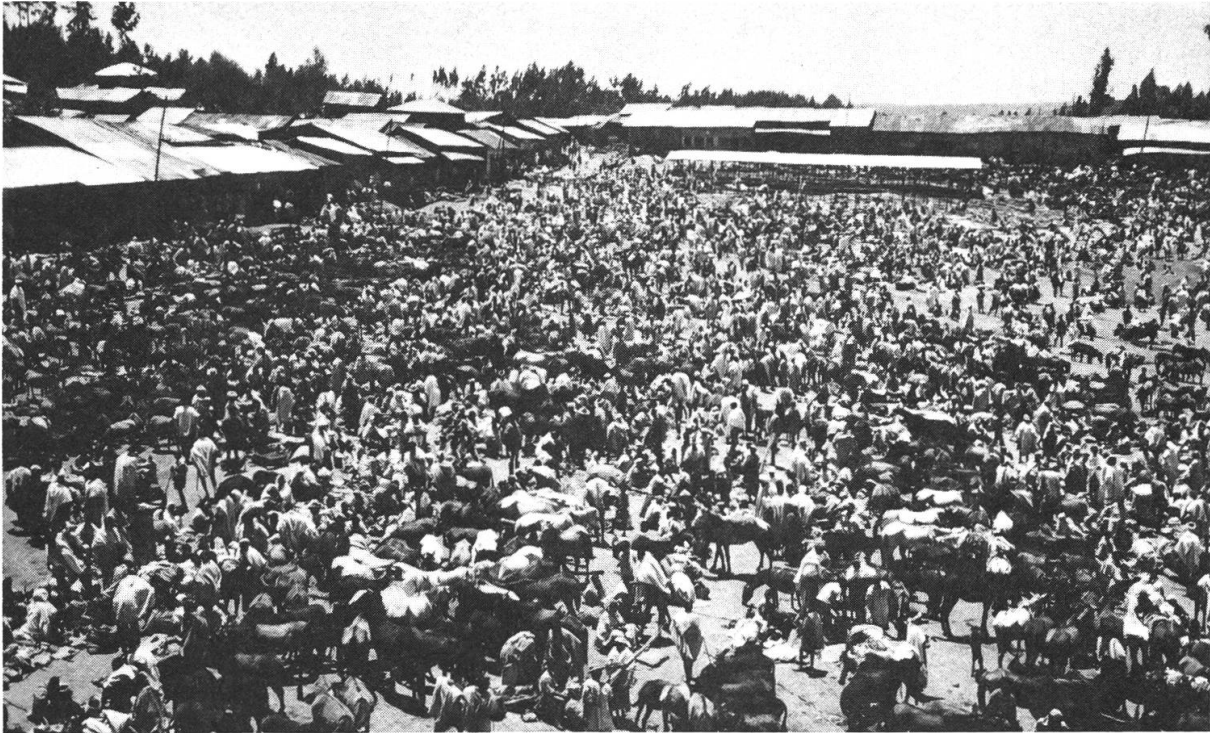
Abbildung 1: Samstagsmarkt in Debark – Anziehungspunkt für Tausende von Semien-Bewohnern. Die Aufnahme zeigt den ersten grösseren Markt nach einigen Jahren verminderter Aktivität während der Revolutionswirren. Noch sind Marktbesucher von jenseits des Bwahit (1 Tagesreise) nicht anwesend. H. Humi, 24. Mai 1980