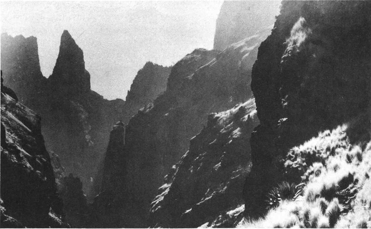
Abbildung 5: Aussicht in die Dirni-Schlucht beim Saha an der Hochlandkante im Nationalpark. Die steilen Grasbänder bilden ideale Lebensbedingungen für die letzten, nur in Semien überlebenden Walya-Steinböcke.