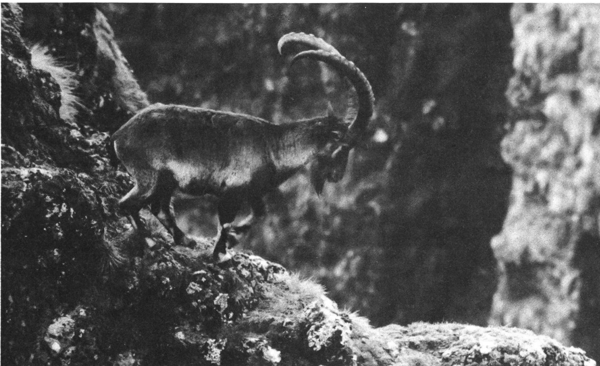
Abbildung 6: Ein über 10 Jahre alter Steinbock in der Dirni-Schlucht. Im Vergleich zum Alpensteinbock unterscheidet sich der Walya-Steinbock durch eine gescheckte Färbung mit weiss-schwarzem Beinmuster und weisslichem Bauch; er ist auch weniger massiv und geschmeidiger als jener.