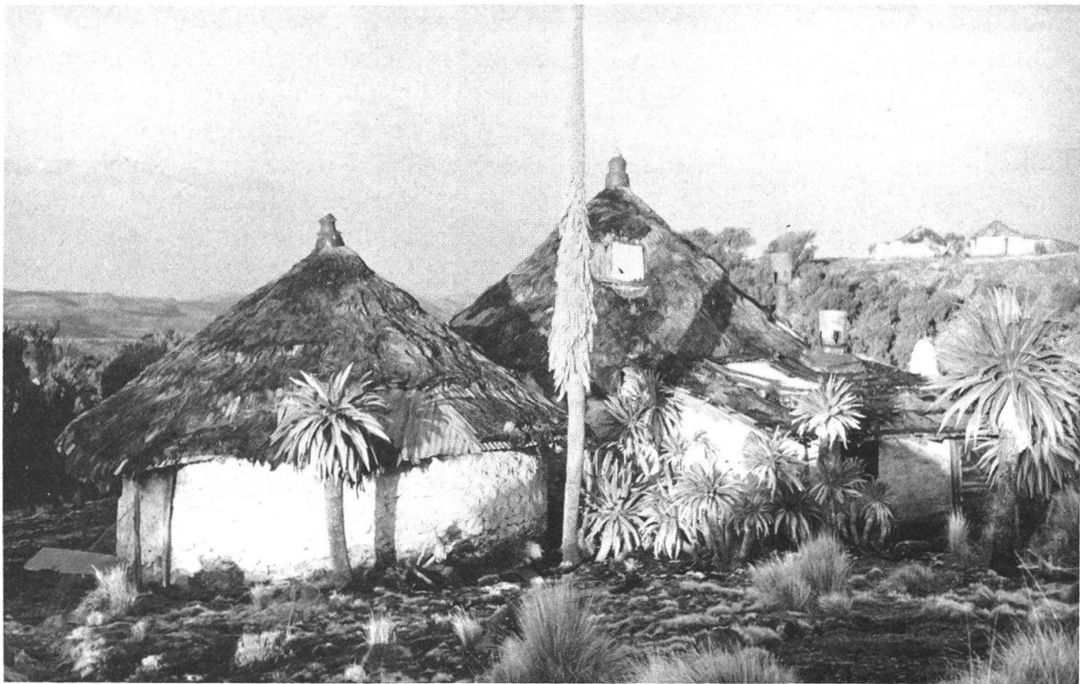
Abbildung 10: Einfache Touristenunterkünfte in Gich Camp – hier das «Swiss House» der schweizerischen Parkwärter 1968–1977. H. Hurni, 21. Mai 1980