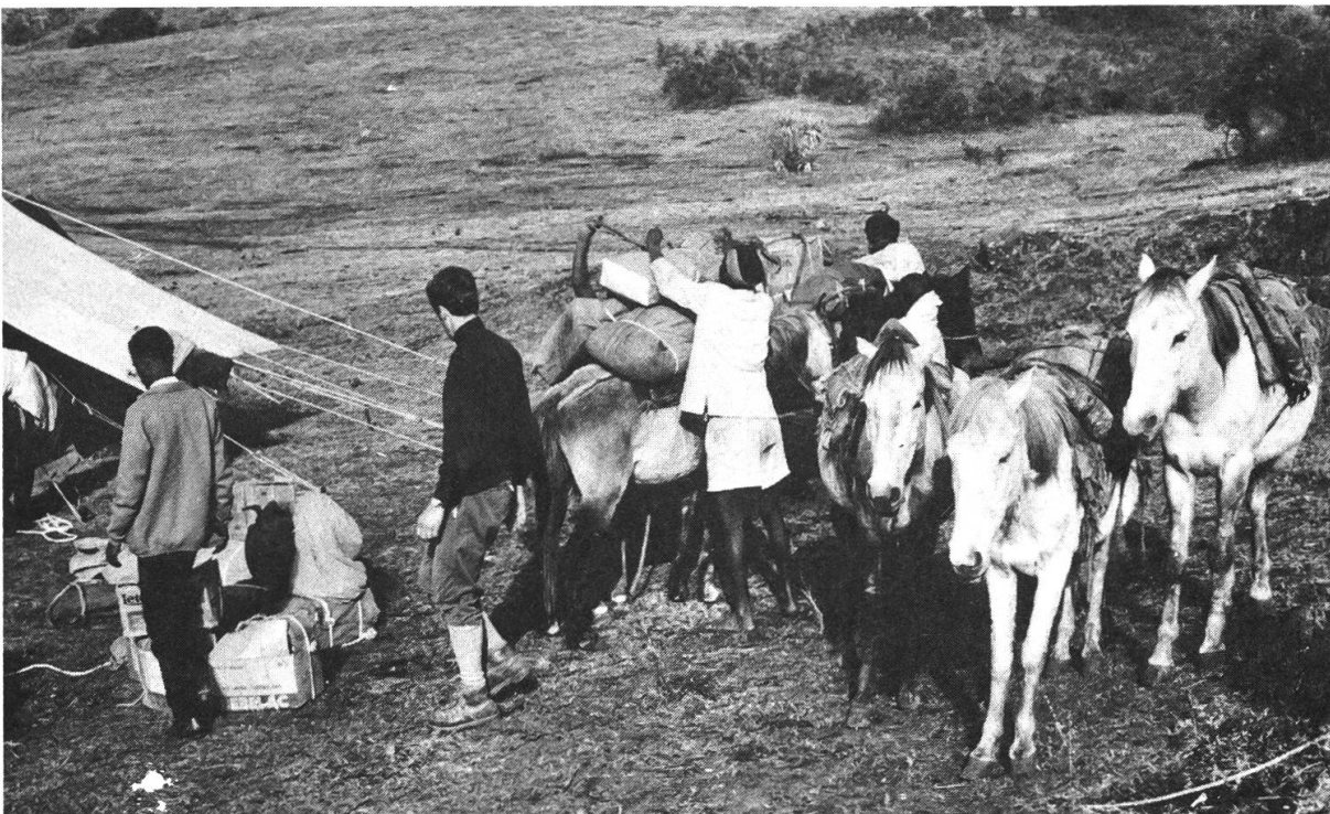
Abbildung 2: Bescheidener Trekking-Tourismus mit kooperativ organisierten Führern und Treibern, zu Fuss und zu Pferd durchgeführt. Dies erscheint als die einzige angepasste Form von Tourismus, die für Semien vertretbar ist. H. Graf, April 1972 in Sankaber