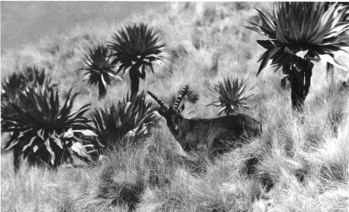
Abbildung 8: Walya-Steinböcke, wie hier der 7jährige Bock, kommen bis hinauf in die flacheren Hänge entlang der Hochland-Kante mit Lobelien-Grassteppe vor und teilen dann diese Plätze oft mit Geladas und Klippspringern. B. Nievergelt, 1968