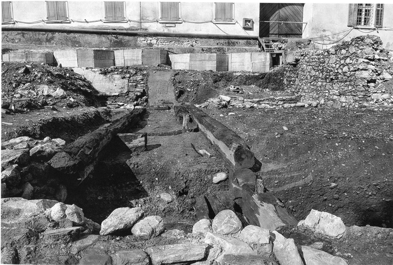
Abb. 54. Chur GR, Bischöfliches Schloss, östlicher Aussenbereich. Der mit Lehm verfüllte Holzkasten zur Abdichtung des Weihers (Bildmitte) und die nördliche Stützmauer (rechts) aus dem 17.Jh. Im Hintergrund das Weiherhaus mit den fünf Schachtfundamenten. Blick gegen Südwesten.

Süden versetzten Mauer wurde zur Abdichtung des Weihers und als Teil der Rampe ein mit Lehm verfüllter Holzkasten erstellt (dendrodatiert in die 1660er-Jahre; Abb. 54). Abgesehen von geringfügigen Renovationen blieb die Weiheranlage bis ins 19. Jh. in dieser Form bestehen. Mit einem 38 m langen, gewölbten Kanal wurde in der 1. H. 19. Jh. der Abfluss an der Nordseite eingedeckt. Nach dem Einbau eines Wasserreservoirs wurde das Weiherbecken in den 1860er-Jahren mit dem Aushubmaterial der Baugrube für die Kantonsschule zugeschüttet.