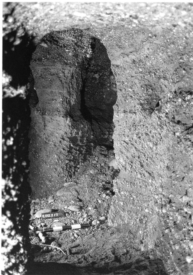
Abb. 53. Baden AG, Römerstrasse 8. Blick in das Stollensystem. Etwa auf Schulterhöhe sind die Nischen für die Beleuchtung sichtbar.

Das Stollensystem lässt sich aufgrund der stratigrafischen Verhält-