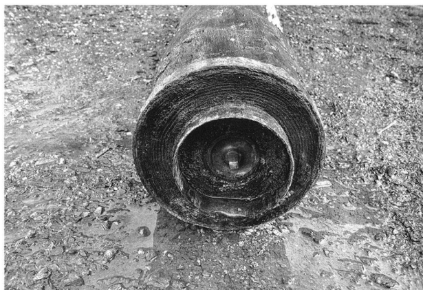
Fig. 55. Echallens VD, Place des Balances 1. Le système de soupape à la jonction des deux éléments de bois.

Bei einer Baggersondierung im Hof- und Parkplatzbereich der Liegenschaft Obergass 9 kamen bis auf einen mit Backsteinen