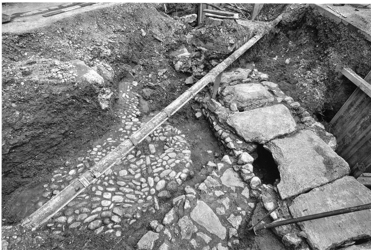
Fig. 58. Rolle VD, Rue du Port - Ruelle des Halles. Le niveau de pavage supérieur et les coulisses découverts à la rue du Port.