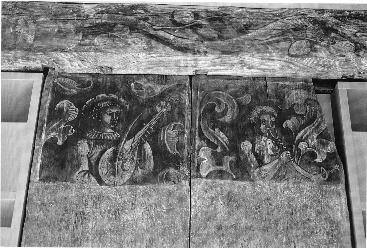
Fig. 56. Fribourg FR, Commanderie de St-Jean. Salle peinte du deuxième étage, remplois de boiseries (vers 1504-45).

Les travaux de 2012 ont encore révélé de nouveaux éléments des aménagements intérieurs du 16 e au 19 e siècle qui complètent les analyses de 2011, mais les datations dendrochronologiques restent à faire.