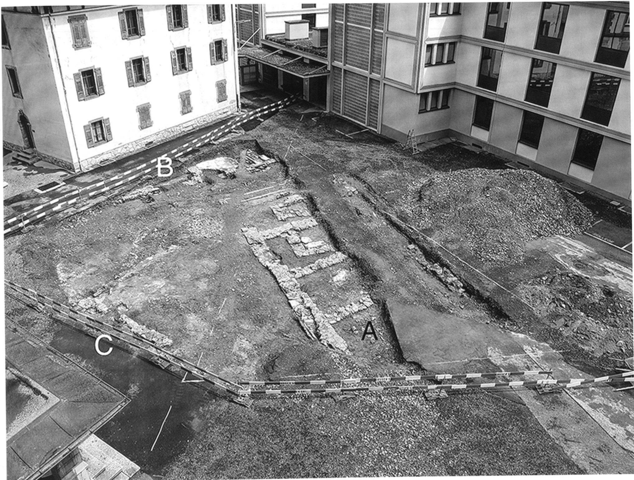
Fig. 59. St-Maurice VS, Abbaye, Cour des Anciens. A fondations du commun; B fondations de l'Ecurie; C margelle du vivier. Vue vers l'est.