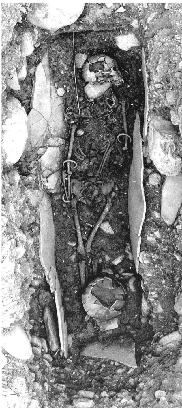
Fig. 9. Sion VS, rue de Loèche 14, «Le Rocher 1». Sépulture centrale du tumulus \lambda (T136): inhumation du Bronze final avec torque, colliers, épingle céphalique, bracelets, anneaux de cheville, ceinture décorée de plaques et disques de bronze et céramique.

ten bereits abgeschlossen. Die Untersuchung beschränkte sich daher auf eine stellenweise Reinigung und Dokumentation der Baugrubenprofile sowie nochmalige Begehung des Aushubs. In den Baugruben wurde auf etwa 2 m unter dem heutigen Gehhorizont ein grau gefleckter siltiger Sand mit Holzkohlefragmenten, gebranntem Lehm festgestellt. Aus dieser Schicht wurden mehrere prähistorische Keramikfragmente geborgen, ein Randstück ist der ausgehenden Spätbronze- oder frühen Eisenzeit zuzuordnen. Innerhalb der Strate waren keine Gehniveaus oder konstruktive Elemente zu erkennen. Zudem wurde die Schicht entsprechend einem leichten Abfallen des anstehenden Sediments keilförmig dicker. Wahrscheinlich wurden die Sedimente sekundär abgelagert, ein Siedlungsbereich ist wohl ausserhalb des durch die Baugruben tangierten Bereichs zu suchen. Unter dem grauen Sand und über dem glazialen Ton folgte ein mit organischem Detritus durchsetzter dunkelbrauner Ton, der auf eine grössere Ausdehnung eines naheliegenden Sumpfbereichs in prähistorischer Zeit verweisen könnte. Die Fundstelle liegt in unmittelbarer Nachbarschaft der Fluren Jetelburg und Rofäcker, wo bronze- und eisenzeitliche Gräber nachgewiesen sind.