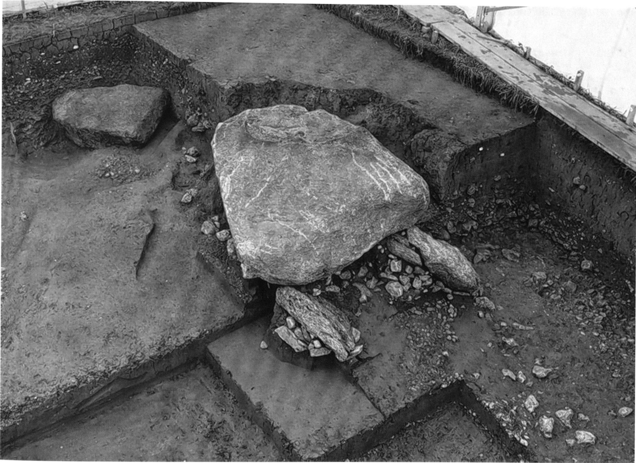
Abb. 6. Oberbipp BE, Steingasse. Der neolithische Dolmen wurde vermutlich vom Hochwasser unterspült und seitlich verschoben. Dies dürfte der Grund für die gute Erhaltung der Skelette sein.

Versuch, den Deckstein zu entfernen, bereits gestört worden. Der grösste Teil der Anlage war aber intakt. Es handelt sich um ein jungsteinzeitliches Kollektivgrab. Es war über Jahrhunderte geschützt durch eine vom Mühlebach eingebrachte Sedimentschicht, aus der nur ein kleines Stück der Deckplatte herausragte. Eine rasche archäologische Untersuchung war unerlässlich, weil beim Eintreffen des ADB die schützende Überdeckung entfernt und die Grabkammer bereits bis auf das Grablegungsniveau geöffnet war. Der Dolmen liegt ausserdem in der Bauzone und muss früher oder später einer Überbauung weichen. Es ist geplant, die Anlage an einem anderen Standort in Oberbipp zu rekonstruieren.