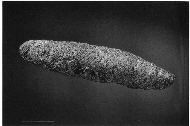
Fig. 5. Meyriez FR, Village. Bobine de fil de lin.

Seul 17 des 199 pieux observés sont des chênes (= 9%). Les autres bois, principalement des essences de bois blanc, accusent souvent