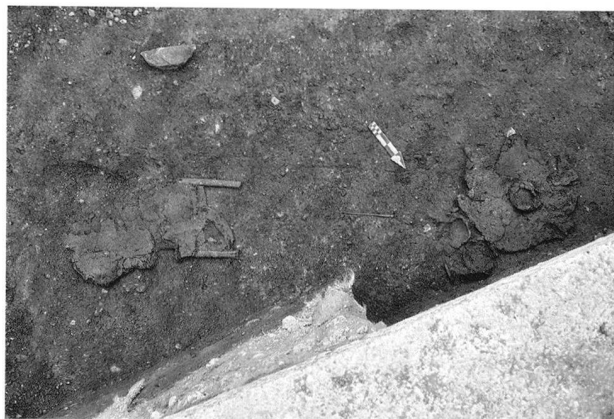
Fig. 8. Nyon VD, parcelle 586, Centre d'Enseignement Post-obligatoire. Tombe du HaB3.

Dabei wurden zwei Befunde der Stufe BzD entdeckt. Es handelt sich um annähernd rechteckige Gruben von 2.60×1.10 bzw.