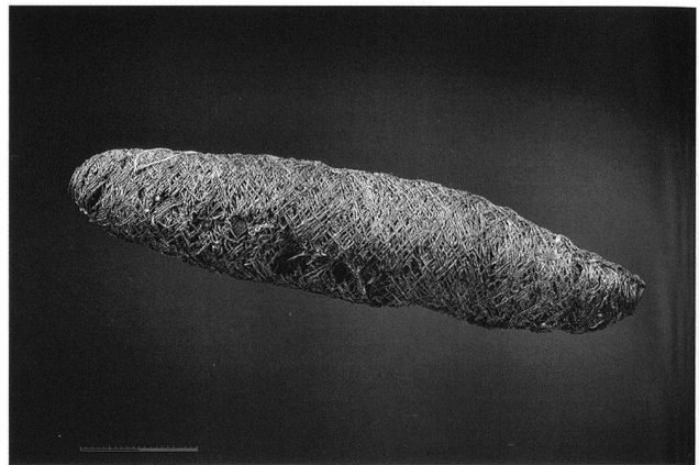
Fig. 5. Meyriez FR, Village. Bobine de fil de lin.

Seul 17 des 199 pieux observés sont des chênes (= 9%). Les autres bois, principalement des essences de bois blanc, accusent souvent