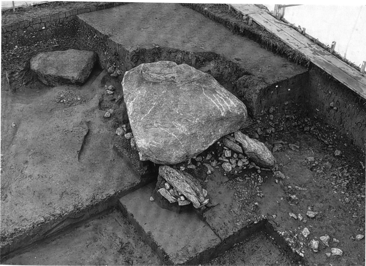
Abb. 6. Oberbipp BE, Steingasse. Der neolithische Dolmen wurde vermutlich vom Hochwasser unterspült und seitlich verschoben. Dies dürfte der Grund für die gute Erhaltung der Skelette sein.

Versuch, den Deckstein zu entfernen, bereits gestört worden. Der grösste Teil der Anlage war aber intakt. Es handelt sich um ein jungsteinzeitliches Kollektivgrab. Es war über Jahrhunderte geschützt durch eine vom Mühlebach eingebrachte Sedimentschicht, aus der nur ein kleines Stück der Deckplatte herausragte. Eine rasche archäologische Untersuchung war unerlässlich, weil beim Eintreffen des ADB die schützende Überdeckung entfernt und die Grabkammer bereits bis auf das Grablegungsniveau geöffnet war. Der Dolmen liegt ausserdem in der Bauzone und muss früher oder später einer Überbauung weichen. Es ist geplant, die Anlage an einem anderen Standort in Oberbipp zu rekonstruieren.