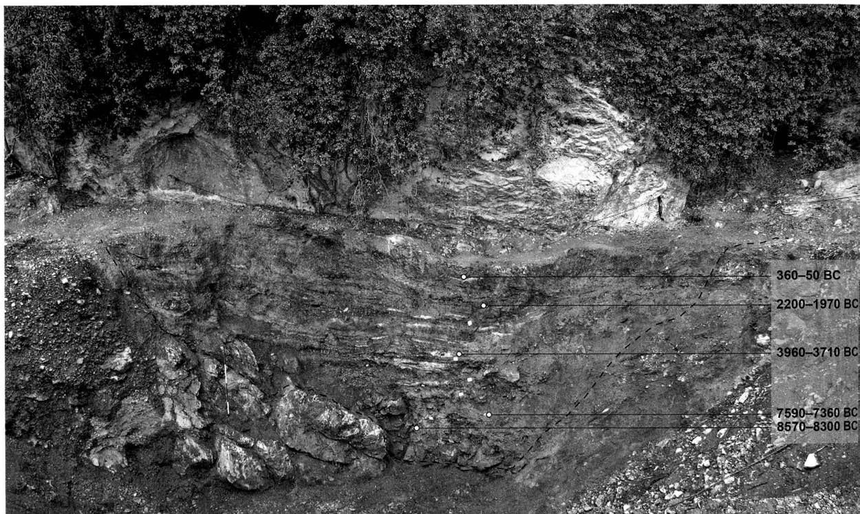
Abb. 4. Oberriet, SG, Unterkobel. Profilsicht der Fundstelle vor Beginn der Ausgrabung. Die unterbrochene Linie markiert die Ausdehnung der archäologischen Schichten, rechts im Bild sind die kalibrierten C14-Datierungen (2 sigma-Bereich) eingetragen.

chen Felswand des Kapf, im Gelände der Bauschuttdeponie Unterkobel, archäologische Schichten angeschnitten. Am 4.5.2011 wurde die Fundstelle von Spallo Kolb aus Widnau als archäologische Fundstelle erkannt und umgehend der KA SG gemeldet. Bei ersten Begehungen wurde das grosse Potential der rund 4.5 m hohen Stratigrafie mit zahlreichen Asche- und Holzkohleschichten schnell deutlich (Abb. 4). Nach verschiedenen Arbeiten (u.a. Sprengungen) zur Sicherung eines Teils der angrenzenden Felswand wurde am 25.7.2011 eine Grabung im zentralen Bereich des Abris begonnen. Dank der Unterstützung der Betreiber der Deponie Robert König AG (Peter und Roger Dietsche; Palmerio Zaru) konnte die Grabung in den Deponiebetrieb in der unmittelbaren Umgebung der Fundstelle integriert werden.