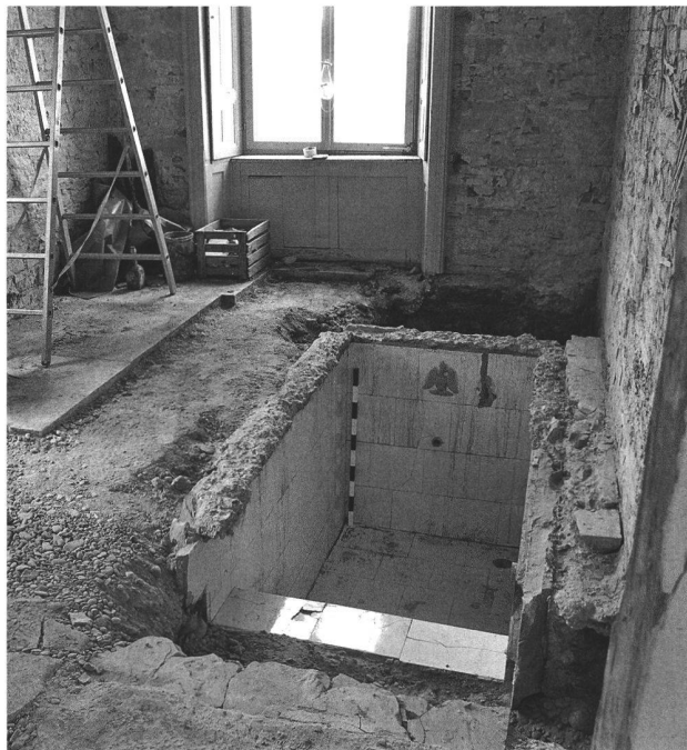
Abb. 48. Salenstein TG, Schloss Arenenberg, Westflügel des Ökonomiegebäudes. Tauchbecken aus mit glasierten Tonplatten verkleideten Sandsteinplatten im südlichsten Raum. Am Kopfende ist eine Tonplatte mit in Relief dargestelltem gekröntem Adler angebracht.

in Richtung der Ofenanlage, diente zum Einleiten von Heisswasser. Die Ofenanlage war in einem zweiten Raum untergebracht und ebenfalls in den Boden eingetieft worden. Wie auch das Becken war der Einfeuerungsraum des Ofens durch eine Treppe erschlossen. Aufgrund von datierten Zeichnungen der Schlossanlage erfolgte die Erweiterung des Westflügels nach 1834 und vermutlich vor dem Verkauf 1843.