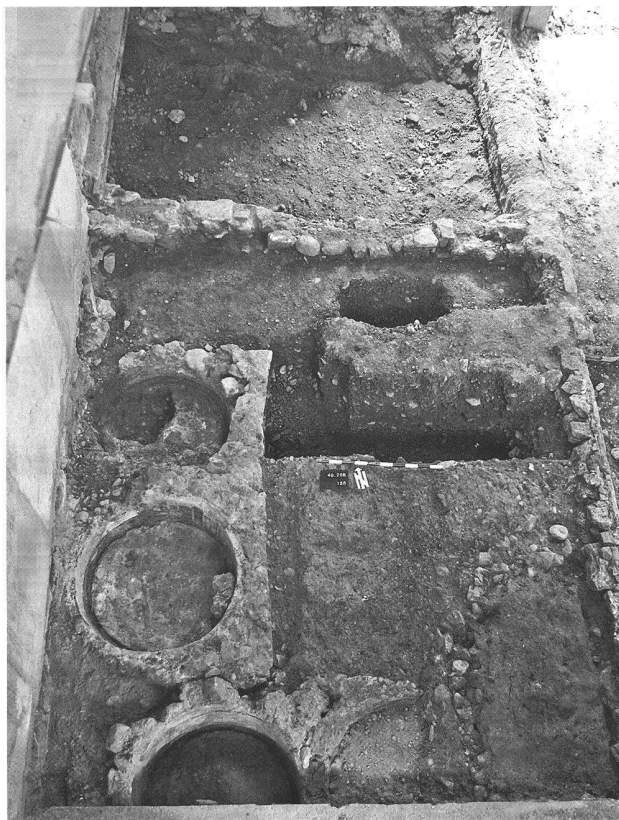
Abb. 47. Liestal BL, Gerberstrasse 27. Ausschnitt der westlichen Gebäudehälfte. Der strassenseitige Teil war mit vier Gerbergruben ausgestattet; im hinteren Gebäudebereich liegt der verfüllte Gewerbekanal.