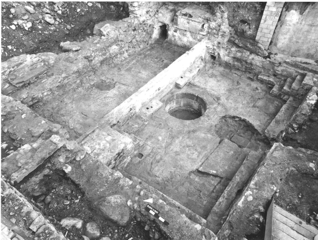
Abb. 40. Baden AG, Bäderquartier, «Hinterhof». Das bisher grösste und älteste Bassin auf Platz. Im Vordergrund bzw. in der rechten Bildhälfte das von Pantaleon 1578 beschriebene, kleinere und jüngere Kessel-Bad («Kessel»).