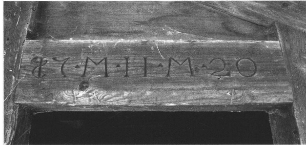
Abb. 49. St. Ursen FR, Tiletz. Inschrift auf dem Türsturz im Dachgeschoss.

La mise à l'enquête de trois maisons individuelles dans le centre