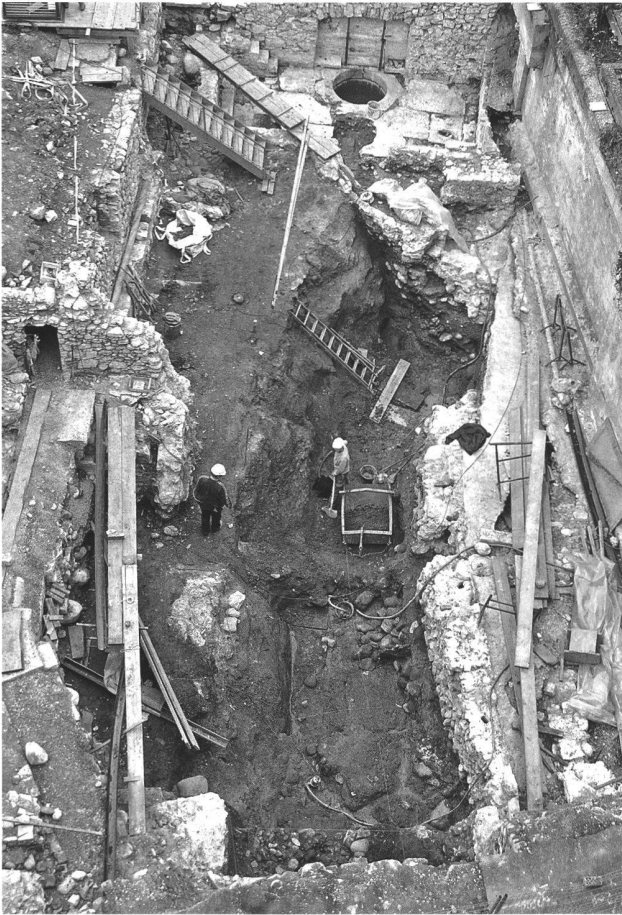
Abb. 41. Baden AG, Bäderquartier, «Hinterhof». In der rechten Bildhälfte, im Vordergrund, die Mauer mit Balkenarmierung(?) von 1416. In der Bildmitte der noch nicht vollständig untersuchte, mächtige, sehr wahrscheinlich römische Graben.

Das bisher älteste Bassin misst ca. 6.50×6.50 m, ist aber nicht exakt rechteckig oder quadratisch, sondern leicht trapezförmig (Seitenlängen 6.75 m, 6.50 m, 6.25 m und 6.00 m). Es muss älter sein als der Beschrieb der Bäder durch den Basler Arzt und Gelehrten Pantaleon von 1578, denn dieser beschreibt ganz klar das nächst jüngere Bassin an genau gleicher Stelle. Anstelle der Trennwand fand er jedoch eine massive, tragende Mauer bzw. eine Wand mit Nische vor. Das Bad bezeichnete er in Anlehnung an die kreisrunde, brunnen- oder schachtartige Konstruktion als «Kessel». Es misst ca. 6.00×3.60 m (Abb. 40). «Das dritte ist der Kessel / so auch ein quell von undenher / unnd doch auch von der grossen Brunnenquelle etliche wasser entpfahen muss. Dises ist bey 20 schuh lang und 12 schuh breit / [...]» (Pantaleon 1578, lxxxiii). Im übrigen lassen sich bis zum heutigen Zeitpunkt mit Sicherheit vier der insgesamt acht von Pantaleon beschriebenen «Wildbeder» eindeutig nachweisen, von den übrigen vier glauben wir, u.a. auch aufgrund des Leemann-Plans (1844/45), in etwa zu wissen, wo sie zu suchen resp. zu finden wären.