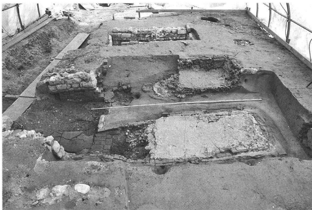
Abb. 46. Langenthal BE, St. Urbanstrasse 40-44. Reste zweier rechteckiger, stehender Töpferöfen zur Produktion von Geschirr und Ofenkeramik, Hafnerei Staub, ca. 1800-1871.

Das Untersuchungsobjekt – der Kopfbau einer Häuserzeile – stand am Rand der sich im Norden der Altstadt im 16. Jh. entwickelnden Vorstadt mit Kleingewerbe, insbesondere Gerberhandwerk. Die Grabung im Erdgeschoss und die Bauuntersuchung lieferten ein umfassendes Bild eines Gerbereibetriebes des späten 16. Jh. (Baudatum 1581 dendro). Das ursprüngliche Gebäudeprinzip war auf die spezifische Nutzung ausgerichtet. So beherbergte das Erdgeschoss strassenseitig mehrere Gerbergruben, an der Ostmauer eine Feuerstelle (Abb. 47). Quer durch die rückwärtige Haushälfte floss ein offener Gewerbekanal. Der Zugang zu den beiden oberen Wohngeschossen erfolgte über einen externen Laubenanbau. Dieser ist in seiner zweiten Phase als Fachwerkbau noch partiell erhal-