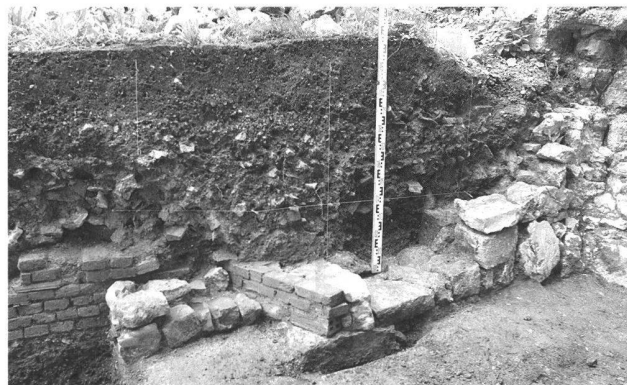
Fig. 44. Bonfol JU, rue de la Vendline. Vue en coupe du four de potier.