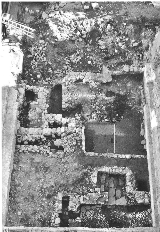
Abb. 39. Appenzell AI, Krone. Blickrichtung Süd. Unten rechts und Mitte links gepflästerte Erdgeschosse in zwei Bauphasen vor 1560. Die Grabung Schmäuslemarkt 2006 war links, nicht direkt anschliessend.

De nombreux ossements animaux, du mobilier en céramique, en