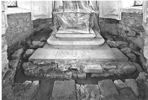
Abb. 45. Egg SZ, Etzelpasshöhe, Kapelle St. Meinrad. Blick nach Osten ins Chor mit teilweise freigelegten Belüftungskanälen unter dem Chorboden der 2. H. 18. Jh.

Atelier d'archéologie médiévale SA, Moudon, G. Faccani und U. Gollnick.