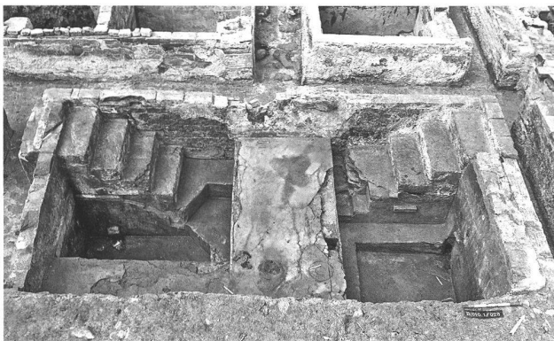
Abb. 43. Baden AG, Bäderquartier, «Limmatknie». Blick in zwei mit Zement ausgestrichene Unterflurwannen (2. H. 19. Jh.) des «Staadhofes». Vom (nicht erhaltenen) Korridor über dem Reservoirsystem führt eine vierstufige Treppe ins Bad hinunter. Zum Baden wird bei einem Wasserstand von ca. 50 cm im Bassin gegessen.