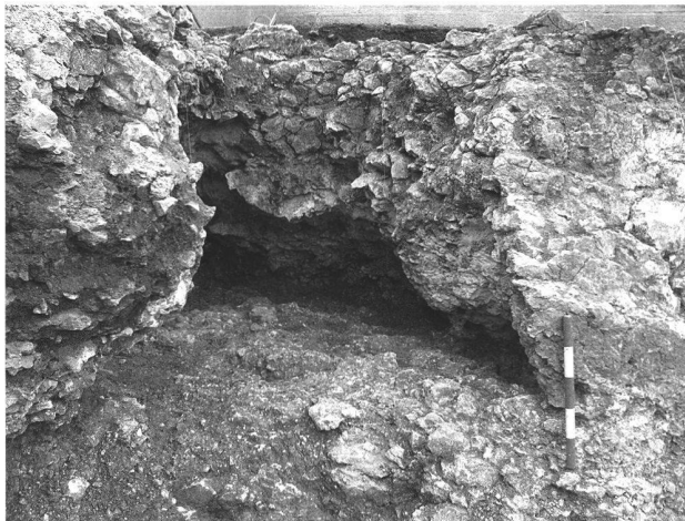
Abb. 3. Olten SO, Chalchofen. Jungsteinzeitliches Silexbergwerk mit 50 cm hohem Stollen.

Par ailleurs, l'emplacement de ce site à proximité de l'alignement de menhirs découvert en 1964 devrait également permettre de préciser leur insertion chronologique malgré l'absence de liens stratigraphiques évidents.