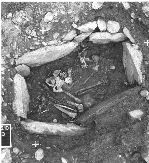
Fig. 4. Sion VS, chemin des Collines 16. Tombe de type Chamblandes en cours de fouille.

Prélèvements: sédimentologiques, anthracologiques, macrorestes, os et charbons de bois pour datations C14.