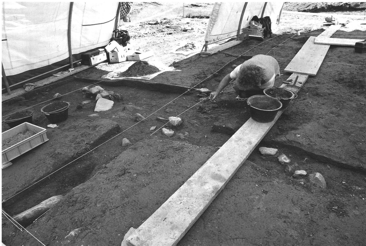
Abb. 1. Hospelthal UR, Moos. Spätmesolithische Fundstelle während der laufenden Ausgrabung 2010.