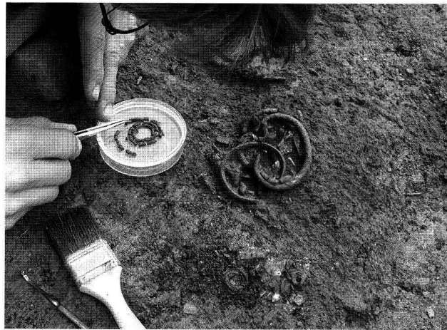
Abb. 6. Birmensdorf ZH, Rameren. Aus einem mittelbronzezeitlichen Brandgrab mit einer weiblichen Trachtausstattung wird eine Bronzespirale geborgen.