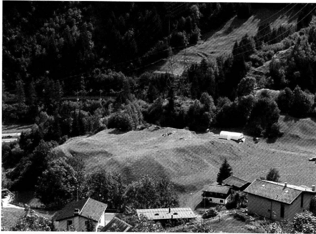
Abb. 5. Airolo-Madrano TI, Mött Chiaslasc. Blick auf die Fundstelle von Nordosten.