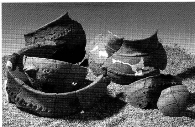
Fig. 7. Cormondrèche NE, Cudeaux-du-Bas. Céramiques provenant de l'anomalie 1.

Vor der Erweiterung einer grossflächig geplanten Inertstoffdeponie führte die Kantonsarchäologie Sondierungen durch. Das Gelände liegt an einem sanften Abhang, der über eine kleine Geländestufe in ehemals sumpfiges Gebiet übergeht. In den Sondierschnitten wurden keine archäologischen Spuren festgestellt.