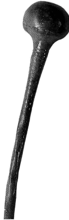
Abb. 10. Triesen FL, Niggabünt. Kugelkopfnadel aus Bronze mit schräg gelochtem Kopf. Am Hals sind mehrere feine, rundumlaufende Rillen zu erkennen. Der gerade Schaft ist tordiert. Gesamtänge der Nadel 10 cm. Obere Hälfte hier im M 2:1 abgebildet.

Wartau SG, Gretschins-Herrenfeld/Ochsenberg siehe Eisenzeit