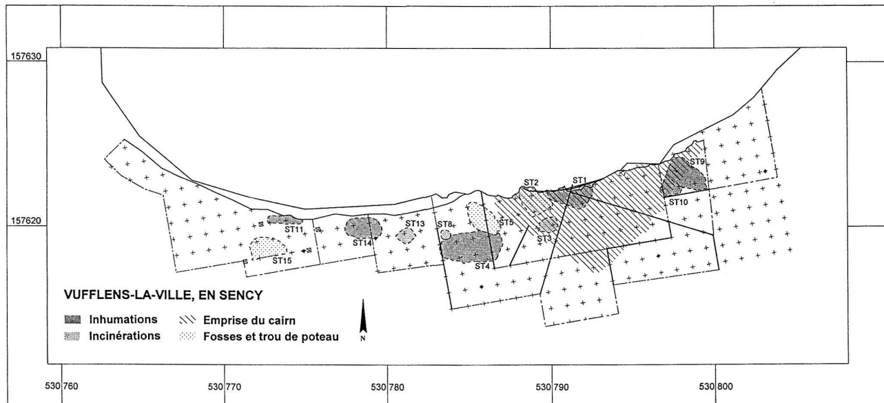
Fig. 5. Vufflens-la-Ville VD, En Sency. Plan des structures. Dessin P. Moinat.

Probenentnahmen: Dendrochronologie, Holzartenbestimmung. Datierung: archäologisch; dendrochronologisch. Älteres Horgen, Späte Schnurkeramik, Frühbronzezeit. BfA Zürich, Tauchequipe.