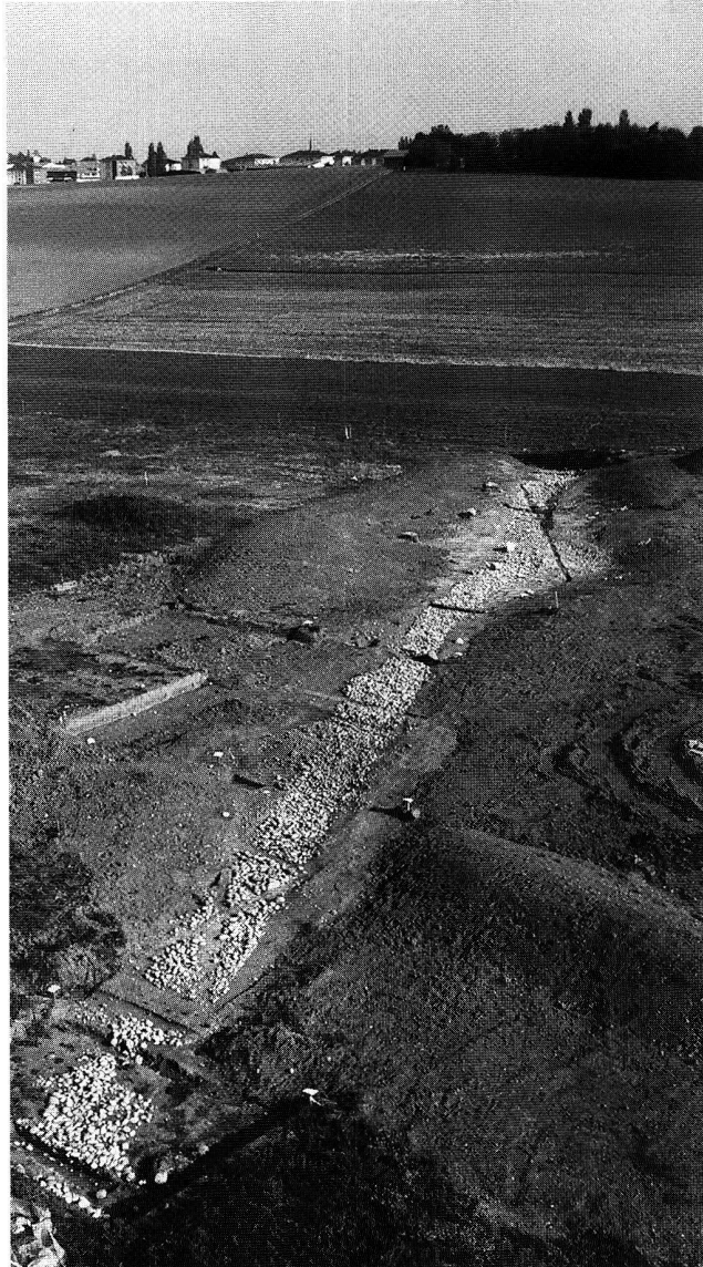
Fig. 4. Cortaillod NE, Petit Ruz. Vue générale de la route, qui se poursuit au-delà de la limite de la fouille.

Dans le cadre d'une première campagne de fouille – projet de l'Association pour la Sauvegarde du Patrimoine de Fully avec le soutien financier de l'ORA VS, de la Commune de Fully et de fonds privés –, 15 sondages de surface restreinte ont été entrepris. Ils ont permis de mettre au jour des structures liées à un habitat (empierrement, fosse, trou de poteau, ...) autour du plateau sommital de l'éperon dont la surface protégée couvre environ 2 hectares. Pour ce qui est des aménagements défensifs au nord de