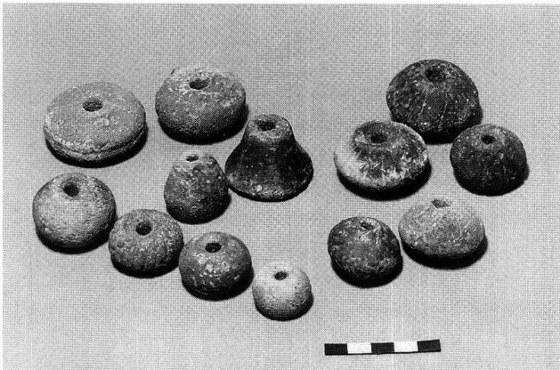
Abb. 6. Attiswil BE, Wybrunne. Spinnwirtel aus der älter-eisenzeitlichen Fundschicht.