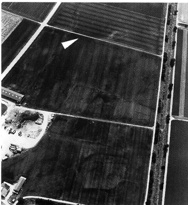
Abb. 2. Luftbild von Neftenbach-Riedt.

Das kurze, NE-SW-orientierte Näfbachtal verbindet die grosse Ebene nördlich von Winterthur mit dem Tösstal; es wird im Norden durch die ansteigenden Höhen des Irchel, im Süden durch den Taggenberg sowie den Hüllibü begrenzt (Abb. 1). Ursprünglich wurde das Tälchen zwischen Neftenbach und Riedt durch verschiedene Bäche (Chrebsbach, Wiesenbach und andere mehr) entwässert. Das Gebiet war damals noch weitgehend von Riedflächen bedeckt 1 . Bis vor wenigen Jahren wurde zudem intensiv Kies abgebaut. Auf Luftbildern sind die wieder verfüllten Kiesgruben deutlich sichtbar (Abb. 2).