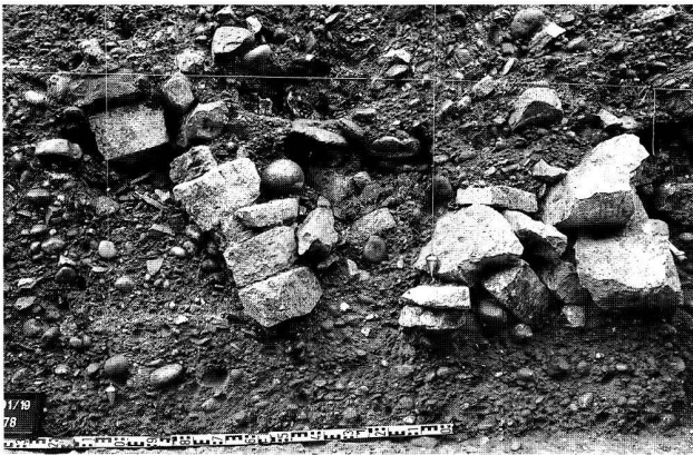
Abb. 7. Basel BS, Rittergasse 4. Querschnitt durch den Murus Gallicus (Ostschnitt 1991). Links die nach vorn gekippte Trockenmauer der Front, dahinter im Wallinnern eine Packung aus Kalkbruchsteinen, vermutlich zur Drainage. Unmittelbar hinter den obersten Steinen der Front wurde ein mittelalterliches Grab eingetieft (das Becken noch in situ ).

bis auf die unterste Lage abgetragen und anschliessend repariert worden. Die Reparatur erstreckt sich aber höchstens auf die vordersten zwei Meter des Walls, das Wallinnere ist nicht davon betroffen und besteht aus einer einzigen Phase, datierbar in die 2. Hälfte des 1. Jh. v. Chr.