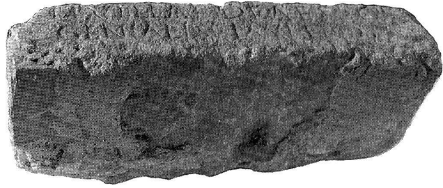
Abb. 2. Avenches VD, Musée Romain Inv.-Nr. 7087. Angestücktes Marmorplättchen.

Die zweite Interpretation, die eine zeitlang die bevorzugte war, zielte in Übereinstimmung mit dem äusseren Aspekt des Steines dahin, in dieser Inschrift nicht eine Grabinschrift, sondern eine Weihinschrift, und zwar eine Weihinschrift an eine bisher nicht belegte gallorömische Gottheit, zu sehen. Es ist möglich, in *Liv- eine keltische Wurzel mit der Bedeutung «Farbe», «Glanz» zu sehen 23 , wofür eine einzige, heute leider verlorene Inschrift aus dem Rheinland eine Annäherung gestattet. Jene Weihinschrift, gestiftet von Cn. Cornelius Aquilius Niger, einem Legionskommandanten der 1. Legio Martia aus dem 2. Jh., ist an Apoll ( Apollini Livici ), mit einem sonst nicht belegten Beinamen gerichtet, was als «Apoll, dem Glänzenden» zu übersetzen ist 24 . Die gallorömischen Gottheiten, ob in der interpretatio Romana oder nicht, tauchen im allgemeinen erst im zweiten und in der ersten Hälfte des dritten Jahrhunderts auf, wobei sie häufig die Erläuterung deus/dea neben sich tragen 25 . Aus diesen Gründen könnte man in Livilla eine bisher nicht bezugte gallorömische Göttin in der Bedeutung «die Glänzende» sehen; allerdings gibt es auch hier gewichtige Gegenargumente, die gegen eine solche Interpretation sprechen: Die epigraphische Formel kennt in überwiegendem Masse die