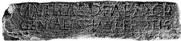
Abb. 1. Avenches VD, Musée Romain Inv.-Nr. 7087. Basis mit Weihinschrift des Genialis für Livilla. Breite 42,5 cm, Höhe 9 cm.

Im Museum von Avenches wird eine interessante Inschrift (Inv.-Nr. 7087; Abb. 1) aufbewahrt, die offenbar schon länger im Museum gelegen hat, aber noch nie vollständig publiziert worden ist 1 . Fotos und Leseversuche zirkulieren schon seit längerem 2 ; in der Literatur wird sie bisher einzig in den paläo- und epigraphischen Untersu-