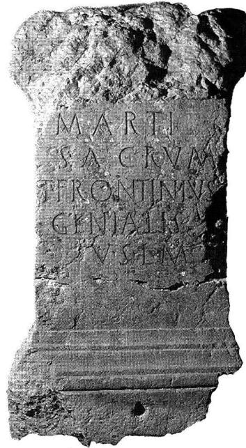
Abb. 3. Cressier NE. Weihealtar des Titus Frontinius Genialis für Mars (CIL XIII 5150 = Walser II Nr. 114). Höhe 128 cm.

Voranstellung der Erläuterung deus/dea , und nur sehr viel seltener die Nachstellung 26 ; dann aber, und dies dürfte entscheidend sein, macht Livilla insgesamt doch einen sehr lateinischen und kaum keltischen Eindruck.