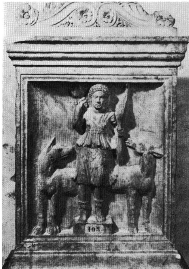
Abb. 6. Paris, Louvre, Réserve des Inscriptions Salle 3, MA 2195, ehem. Rom, Slg. Campana. Grabaltar mit Frau, concecrist zu Diana; flavisch. Höhe 105 cm.

Auch wenn diese Interpretation als Privatkonsekration nicht vollständig gesichert werden kann, so sprechen doch sehr viele Elemente dafür, und die Inschrift darf als interessantes Dokument und weiteres Zeugnis für die starke Romanisierung von Avenches gelten.