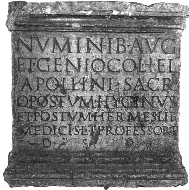
Abb. 5. Avenches VD, Musée Romain. Weihealtar des Quintus Postumus Hyginus und seines Freigelassenen Postumus Hermes für Kaiser-Numina, den Kolonie-Genius und Apollo (CIL XIII 5079 = Walser I Nr. 77). Höhe 57 cm.

Die zweite Inschrift enthält auch eine Wendung, die an das Wort sacrum der Livilla-Inschrift anklängt. Auf anderen Inschriften des gleichen Zusammenhanges mit etwas anderen Eingangsformulierungen wird das Wort sacrum geradeswegs gesetzt 54 , woraus als vergleichbarer Text nochmals die Inschrift AE 1903, Nr. 128 aus Rom herausgegriffen werden darf 55 : Pobliciae/Cale/Bonae Deae/sacrum/Martialis/servos . Das Freigelassenenmilieu kommt in diesen Inschriften deutlich zum Ausdruck 56 . Dass die hier vergöttlichte Livilla ebenfalls eine Freigelassene gewesen ist, ist möglich; wohl stand sie in irgendeiner Beziehung zu Genialis, vermutlich war sie seine Gattin. Dann würde die Inschrift im Gebiet der Helvetier erstmals eine Freigelassenenfamilie bezeugen, wie sie beispielsweise für Lyon nachgewiesen sind 57 . Schliesslich kann auch an ähnliche Inschriftenträger erinnert werden, da nicht nur mit Inschriften versehene Grabtempel oder Grabaltäre, sondern einmal auch in vergleichbarer Art eine Inschrift auf einem Statuensockel erhalten ist 58 .