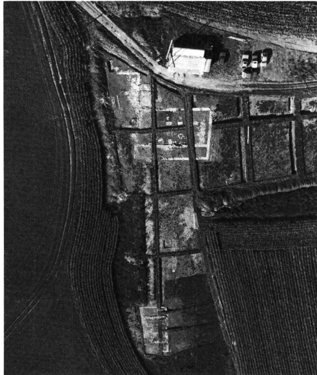
Fig. 2. Vue aérienne des deux bâtiments.

En raison de la disposition en terrasse de l'édifice, les niveaux archéologiques ne présentent pas partout le même état de conservation. La terrasse supérieure, comprenant toute la partie orientale de la maison, a été complètement arasée jusqu'au terrain naturel, si bien que les aménagements domestiques et les éventuelles cloisons légères qui devaient compartimenter cette zone ont entièrement disparu. La terrasse inférieure, visible sur près de 5 m, consiste en un grand espace à l'avant du bâtiment. Le sol, composé d'une épaisse couche de terre battue, est consolidé par un radier fait de nombreux éclats de calcaire du Jura. Les restes d'un foyer domestique assez important, matérialisé par de nombreux fragments de molasse rubé-