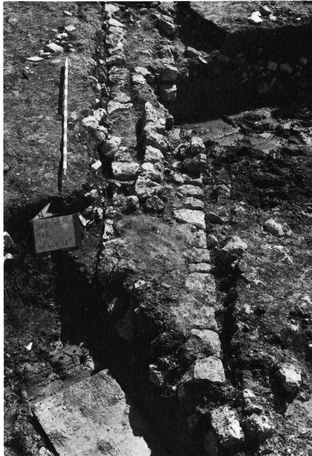
Fig. 6. Mur de clôture(?). La forte poussée de la pente se marque par une inclinaison très nette du mur et par le glissement du parement septentrional; vue de l'ouest.

Malgré l'arasement des vestiges archéologiques, la campagne de fouilles 1988 a livré de nombreuses informations. La mise en évidence du plan, la découverte de plusieurs niveaux de sols conservés dans le bâtiment nord et l'établissement d'une chronologie relative pour les deux édifices en sont les premiers éléments. L'étude des structures et du mobilier archéologique prélevé dans les niveaux en place, ainsi que certaines analyses spécialisées (palynologie, ostéologie) seront effectuées en 1989 5 .