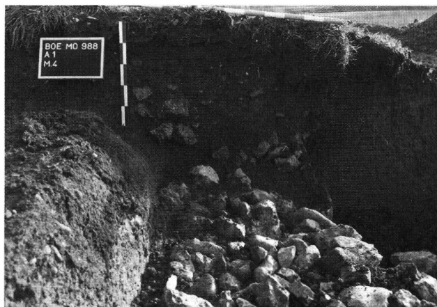
Fig. 4. Bâtiment nord. Mur occidental du bâtiment quadrangulaire. La fosse de récupération se distingue nettement; vue du nord. Photo B. Migy.

fiée et par des blocs de calcaire brûlés occupent le centre de cette terrasse. La toiture de l'édifice, faite de tuiles, s'est effondrée sur le sol. Toutefois, l'état de conservation des niveaux archéologiques supérieurs ne permet pas de déterminer avec précision les espaces couverts ou à l'aire libre.