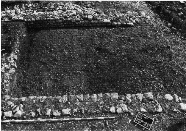
Fig. 5. Bâtiment sud. Pièce du dernier état accolée au bâtiment primitif; vue de l'est.