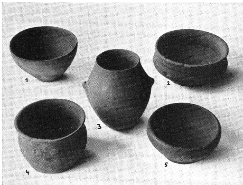
Tafel XVIII, Abb. 2 Eschen-Lutzengüetle. Ergänzte Gefäße (Nr. 1 aus Grabung 1942, obere Schichten Nr. 2 und 5 aus Schichten II und III — Nr. 3 und 4 aus Schicht 5) (S. 93) Aus JB. Hist. Ver. Liechtenstein 1944