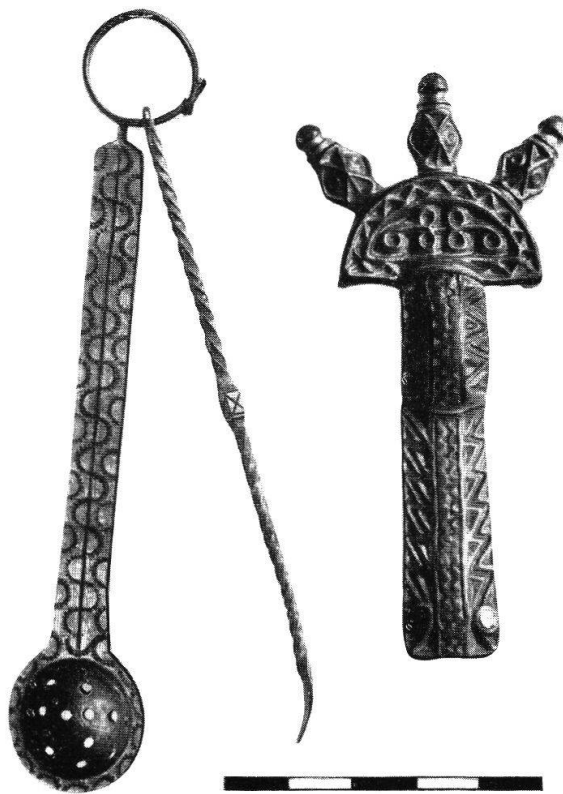
Tafel XVII, Abb. 1. Lausanne. Sieblöffelchen und verstümmelte Fünfknopffibel (S. 87) Aus JB. Hist. Mus. Bern XXIII