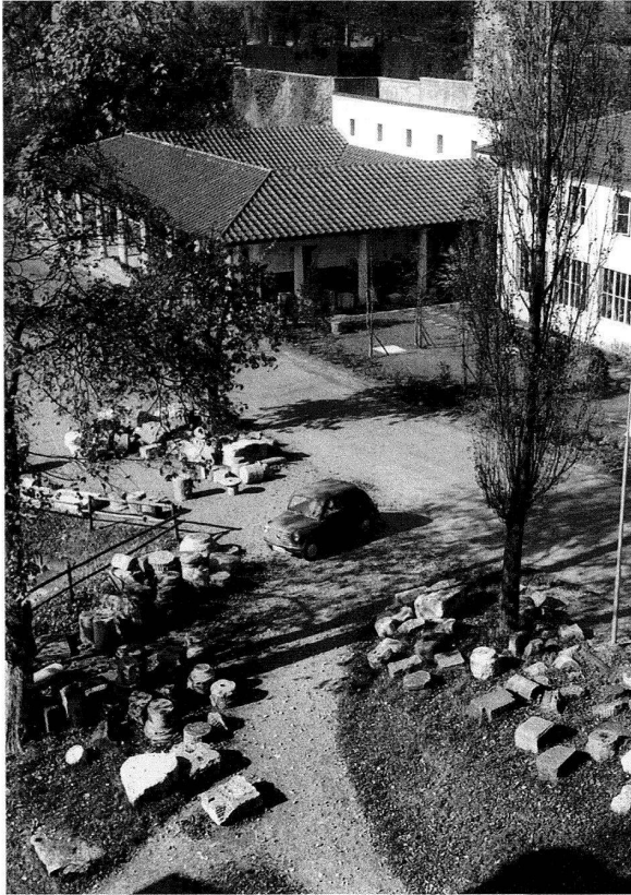
Abb. 6: Das Augster Römerhaus (erbaut 1954/55) und das soeben rechts angebaute Römermuseum 1957 in einer heute kaum mehr vorstellbaren Beschaulichkeit. Blick vom mittleren Zuschauerrang der Theater-Nordwestecke.

zwei befreundeten deutschen Offizieren von Halle aus Richtung Königsberg, dann zurück nach Berlin und von dort mit kräftiger Windunterstützung in die Nähe der Krim, wo er nach über 30 Stunden Flugzeit landete und als deutscher Spion ins Gefängnis gesteckt wurde, aus dem er glücklicherweise rasch wieder herauskam. In Berlin empfing man die Rückkehrer mit Militärmusik und begrüßte sie «als nationale Pioniere»! Nach dem Erwerb des Pilotenbrevets war er als erster Basler Besitzer eines in ganz Basel bekannten Sportflugzeugs, dem so genannten «Frosch», mit dem er mehrmals seinen Bruder Gilbert (1883–1927), Schriftsteller und Schöpfer eines futuristischen Balletts, besuchte, der sich in Positano aus einem verfallenen Sarazenturm einen