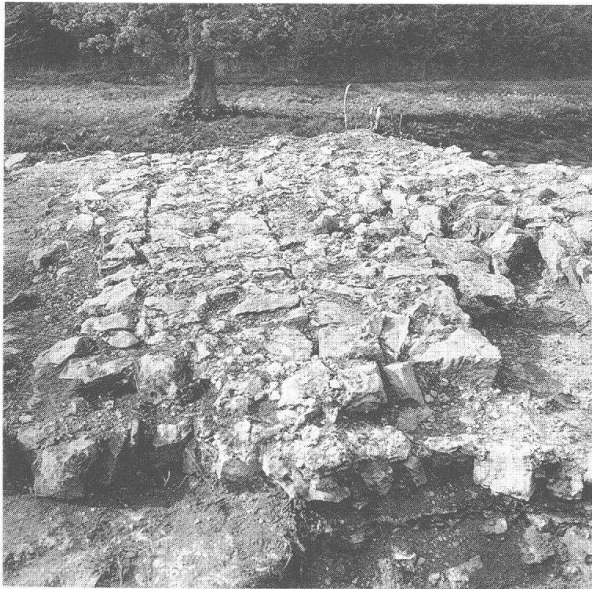
Abb. 1 Augst-Schönbühl. Zustand des Tempelpodiums nach der erneuten Freilegung 1957/58 (vor der Restaurierung).

bauten wollte man auch hier mit dem relativ hohen Podium den Sakralbau über das Terrain herausheben. Da das Gelände gegenüber dem Theater an der Oberfläche eher flach ist und der Tempel am westlichen Rand steht, wäre er ohne dieses Anheben nicht richtig zur Geltung gekommen. Ich meine auch, dass man dem Theaterbesucher bewusst Einsicht auf die gegenüberliegende Tempelanlage geben wollte und dass sie sogar bei gewissen Theaterraufführungen mit einbezogen wurde.