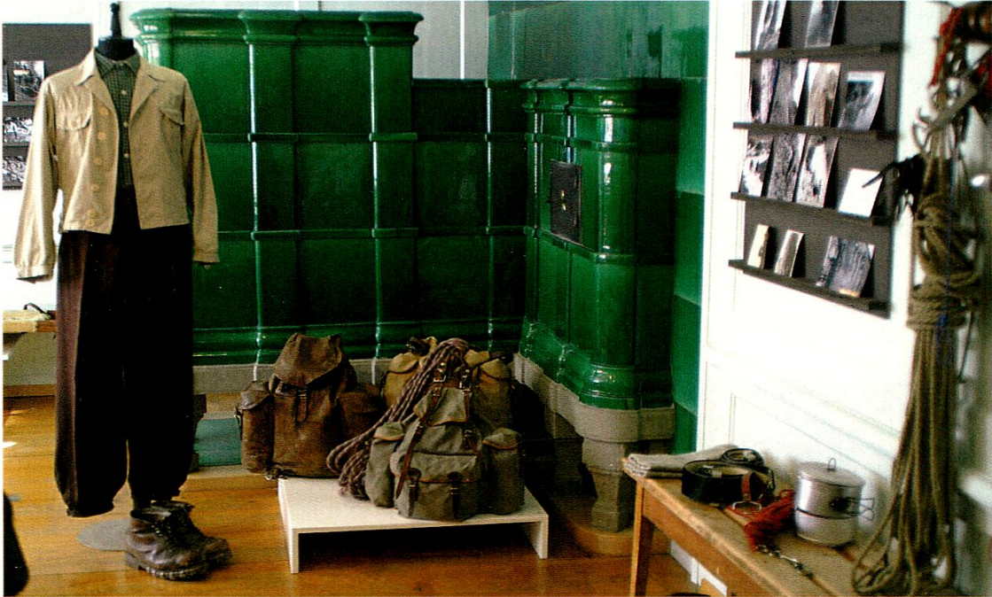
Blick in die Bergrettungs-Ausstellung.

Innerrhoder Bergrettung. Ein umfangreiches und sehr gut besuchtes Begleitprogramm mit Führungen, Vorträgen und Filmen wurde ergänzt durch die monatlichen öffentlichen Übungen der Rettungskolonne Appenzell.