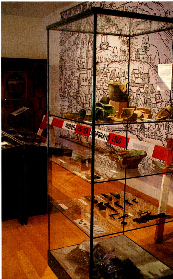
Blick in die Archäologie-Ausstellung.

Der Brand von 1560 ist einer der markantesten Einschnitte in der neuzeitlichen Geschichte des Dorfes Appenzell. Appenzell gedenkt diesem Ereignis seit 450