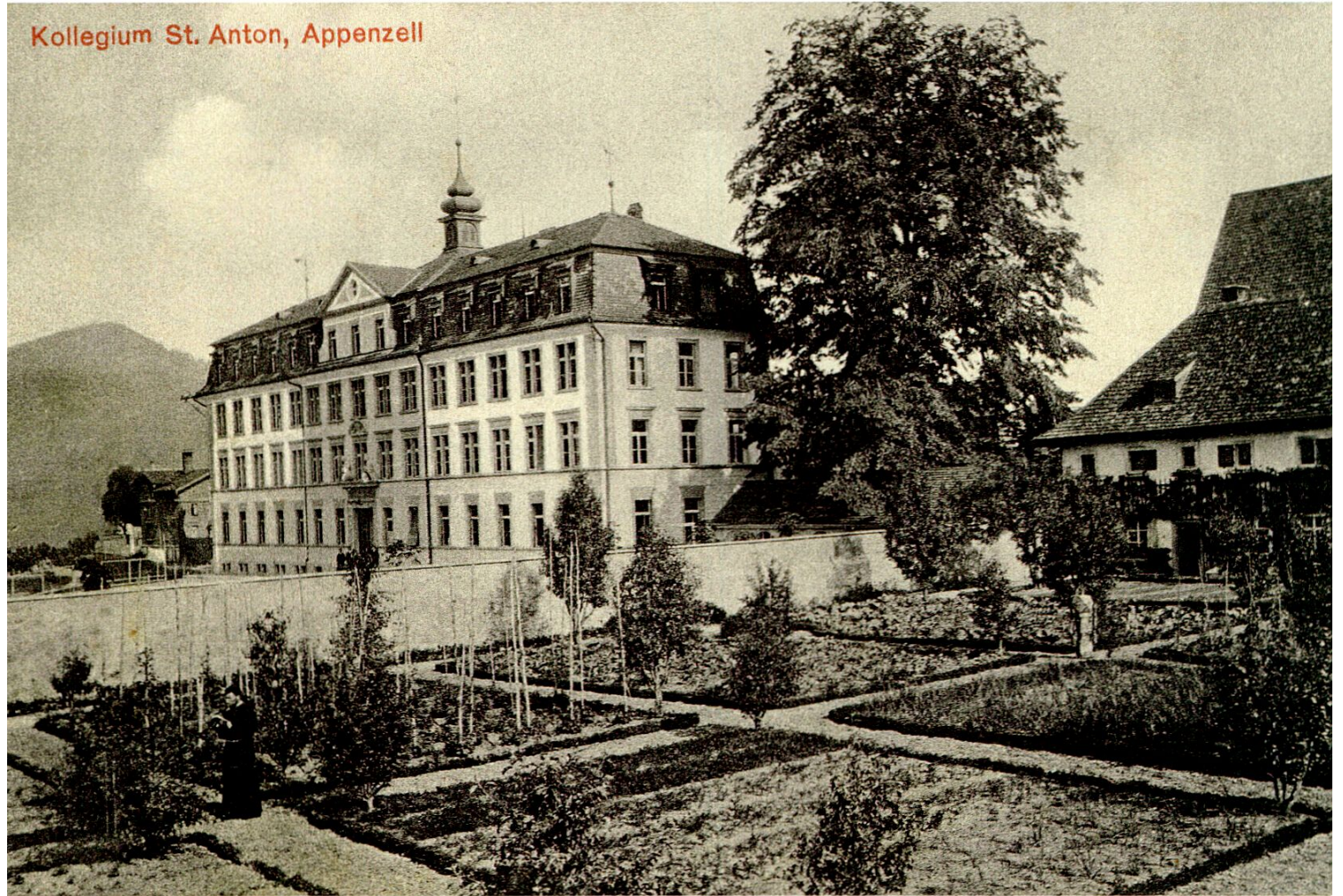
Der Kapuzinergarten von Appenzell auf einer Ansichtskarte, nach 1908.

findet ihre Grenze in der alles umschliessenden Mauer, die rechtlich zugleich Klausur bedeutet.