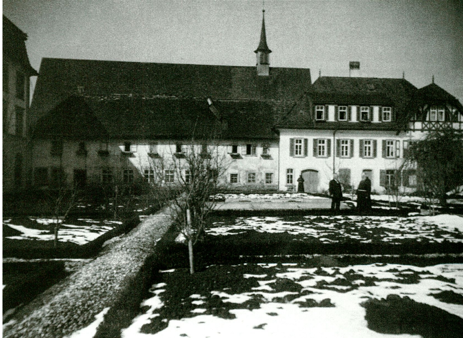
Noch liegt etwas Schnee im Kapuzinergarten von Appenzell. Nach 1906, vor 1925.