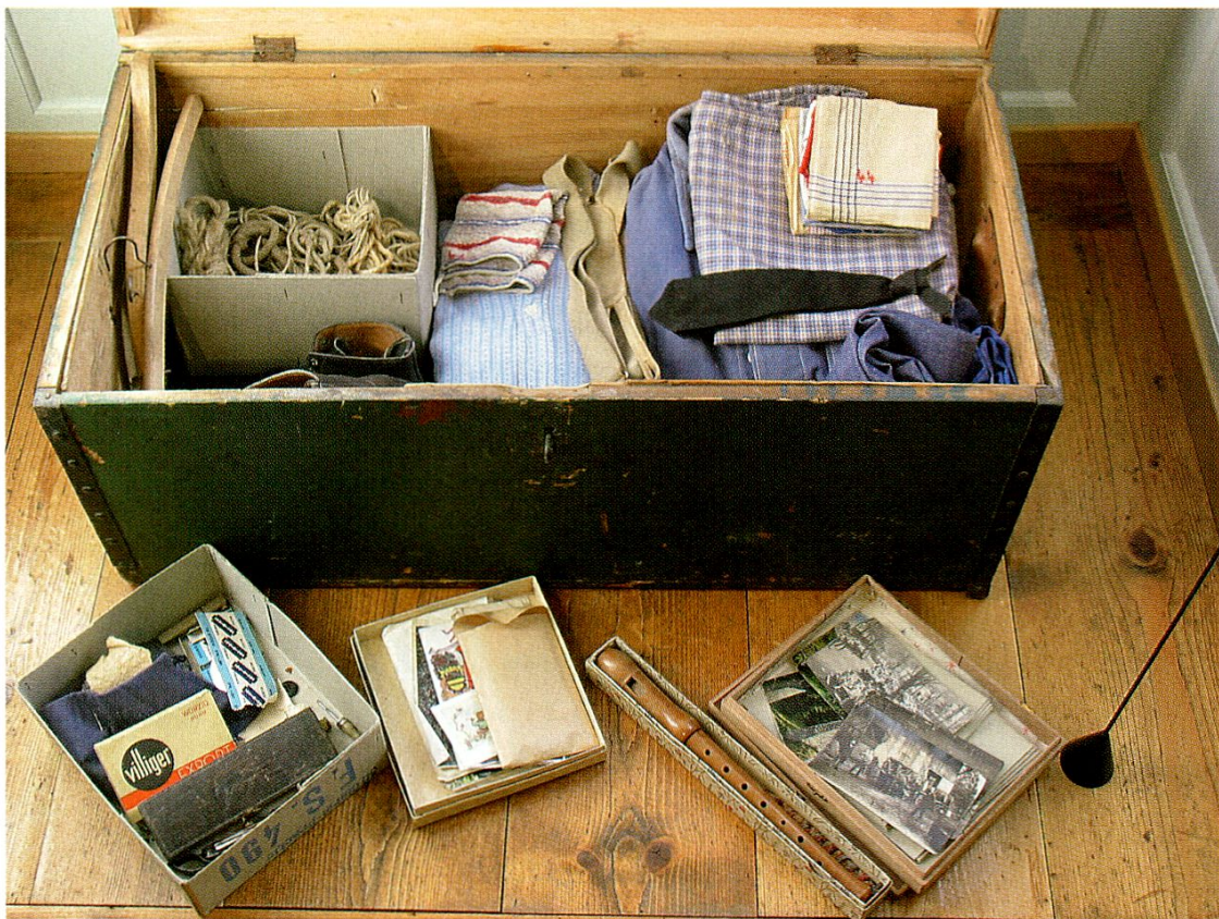
Geschenk aus dem Bürgerheim Appenzell. Die Habseligkeiten eines Armenhäuslers, 1. Hälfte 20. Jahrhundert.

Die in der Sonderausstellung gezeigten Geschenke aus den vergangenen rund zehn Jahren hatten die Absicht, eine «Idee» zu vermitteln, was und wie heute im Museum Appenzell gesammelt wird – und welche «Denkmale» dem Museum auch in Zukunft geschenkt werden könnten ... Nicht nur der gute Besuch der Ausstellung, sondern auch die unten stehende Geschenkliste belegen, dass das gesteckte Ziel der Jubiläumsveranstaltung erreicht werden konnte.