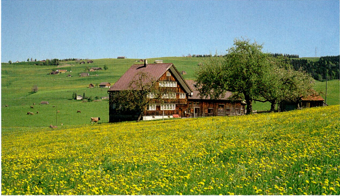
Emil Grubenmann: Bauernhaus Horners in Steinegg, o.J.

Das Erscheinen des Bauernhausbandes war für das Museum Appenzell Anlass, eine Sonderausstellung zum selben Thema zu realisieren. Dabei ging es weniger um eine wissenschaftliche Abhandlung als vielmehr um spontan zusammen getragene Impressionen zum Thema. Isabell Hermann hatte im Rahmen ihrer Forschungsarbeit unzählige Bildzeugnisse und Objekte gesichtet und ausgewertet, wovon ein Teil in der Sonderausstellung erstmals öffentlich gezeigt wurde. Einen wichtigen Schwerpunkt bildeten rund 25 Bauernhaus-Zeichnungen des bekannten St. Galler Zeichners Salomon Schlatter (1858-1922), die vom Schweizerischen Landesmuseum zur Verfügung gestellt wurden. Ein wichtiger Fundus für die Ausstellung bildeten die museumseigenen Fotosammlungen der Fotografen Müller, Bachmann und Grubenmann. Zu sehen waren aber auch dreidimensionale Objekte wie Bauernhaus-Modelle, Spielzeuggaden oder Inneneinrichtungen von Bauernhäusern.