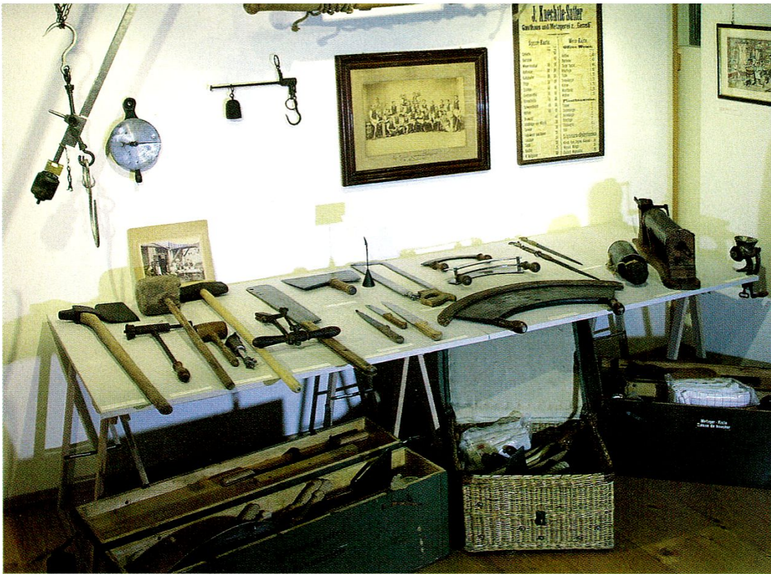
Blick in die «Metzger-Abteilung» der Ausstellung «Gott segne das ehrbare Handwerk». 150 Jahre Kolpingfamilie Appenzell.

Am Samstag, 30. August (am eigentlichen Jubiläumswochenende), konnten die an der Ausstellung Beteiligten (Bäcker-Konditor, Bauernmaler, Devislimalerin, Sennensattler, Hackbrettbauer, Kunstschlosser, Kupferschmied, Handstickerin u.a.) bei ihrer Arbeit beobachtet werden. Zusätzlich verlegte jeden Donnerstag- und Freitag-Nachmittag ein Kunsthandwerker beziehungsweise eine Handstickerin seinen oder ihren Arbeitsplatz ins Museum.