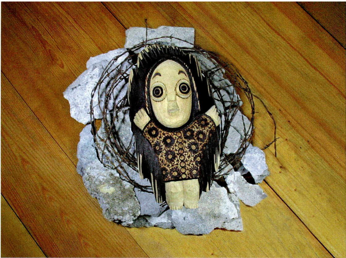
Christkind der so genannten Auschwitz-Krippe von Jan Staszak, um 1950.

In der Ausstellung «Da mitten in der Nacht» – Krippen aus aller Welt» waren rund 120 Krippen zu sehen. Das Spektrum reichte von einer Alabasterkrippe aus Venezuela über ein Krippenbild mit Bananenblättern aus Kenia bis zu den Zündholzschachtel-Krippchen aus verschiedenen Ländern. Einen Schwerpunkt bildeten die besonderen Krippendarstellungen aus dem Erzgebirge mit den faszinierenden Weihnachtspyramiden, Schwibbogen oder Lichterengeln, die allesamt durch die Bergwerksarbeit in dieser Gegend geprägt sind.