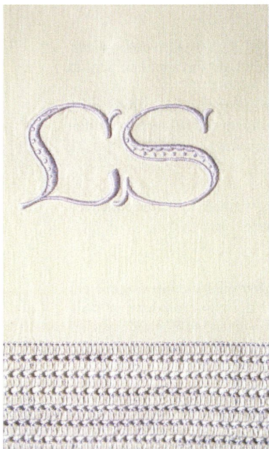
Besticktes Leintuch mit Hohlsaum und Initialen «LS».

Was die Brautleute, Frau und Mann, mit in die Ehe mitzubringen hatten, war regional unterschiedlich geregelt. In der Ostschweiz musste die Braut beziehungsweise der Brautvater fast für die ganze Aussteuer aufkommen. Ein wichtiger Bestandteil waren Bett-, Tisch- und