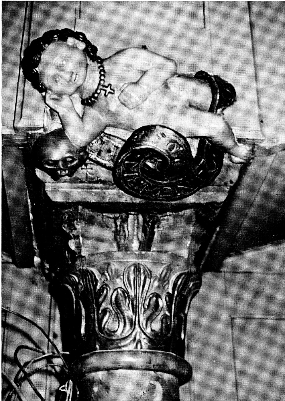
Abb. 1 Das Bild im Schloss zu Appenzell.

Hinfälligkeit des Menschen noch besonders hervorgehoben und unterstrichen: schon das Kleinkind in seinen ersten Lebensjahren ist todesbedroht, umso mehr natürlich der erwachsene Mensch. Der Putto selbst tritt uns bald als Knabe, bald als Mädchen, bald als geflügeltes Wesen (als Engel) entgegen.