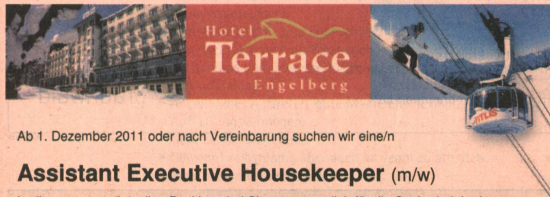
Ab 1. Dezember 2011 oder nach Vereinbarung suchen wir eine/n