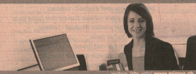
weitere Jobs unter www.migros.ch

Kommt der Appetit? Die grosse Palette der Migros-Gastronomie deckt vielseitige kulinarische Bedürfnisse ab. Migros-Take Away, Selbstwahl-Restaurant und Bonaparty-Catering der Migros Ostschweiz sorgen für einen rundum feinen Genuss. Wir suchen für unseren Catering Bonaparty per 1. November 2009 oder nach Vereinbarung eine/n