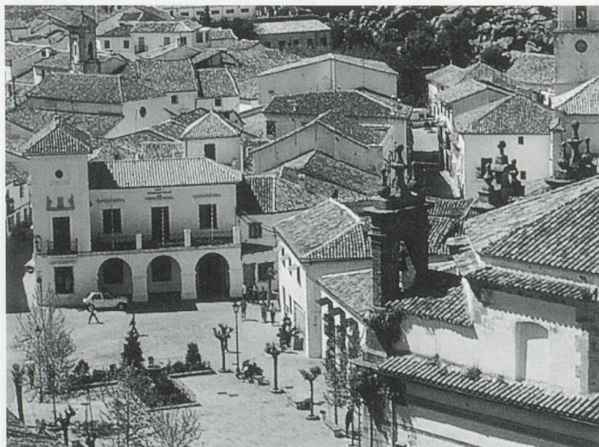
Ein weisses Dorf: Blick auf den Marktplatz von Grazalema

Diese Reise wird durch ARCATOURL in Zusammenarbeit mit dem Zuger Vogelschutz und der Pro Senectute organisiert.