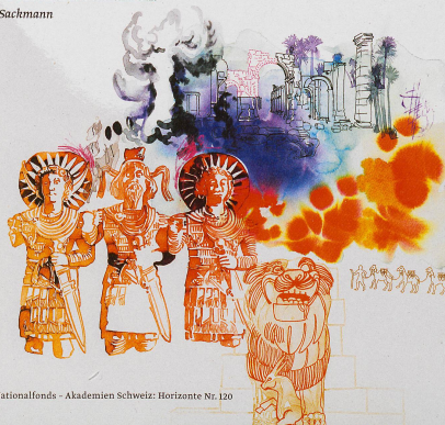
Illustration: Irene Sackmann

Stellt man sich wissenschaftliche Arbeit vor, denkt man nicht als erstes an gefühlvolle Momente. Aber die gibt es. Forschung kann ergreifen und glücklich machen, kann verärgern oder in Aufregung versetzen. Vier Forschende erzählen.