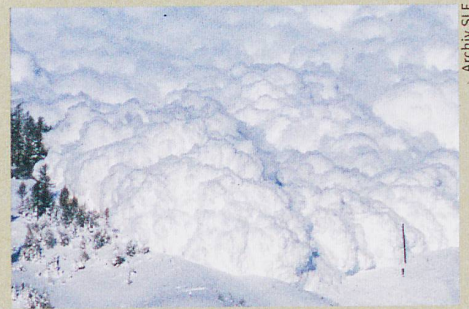
Arbaz im Wallis: Ein neues Radargerät durchschaut künstliche Staublawinen.