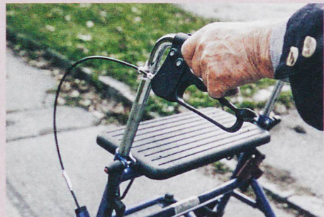
Manche Senioren lehnen den Rollator ab, weil sie dem Bild der fiten Alten entsprechen wollen.

F. Rickli: Old, disabled, successful? Transfigurations of aging with disabilities in Switzerland. In: Medical Anthropology Theory (in preparation).