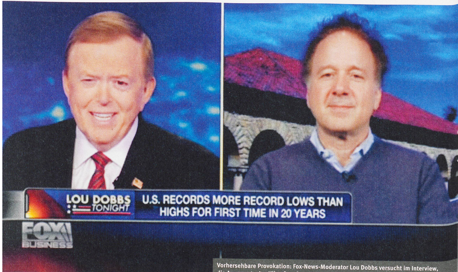
Vorhersehbare Provokation: Fox-News-Moderator Lou Dobbs versucht im Interview, die Argumente des Klimaforschers Ken Caldeira ins Lächerliche zu ziehen. Screenshot