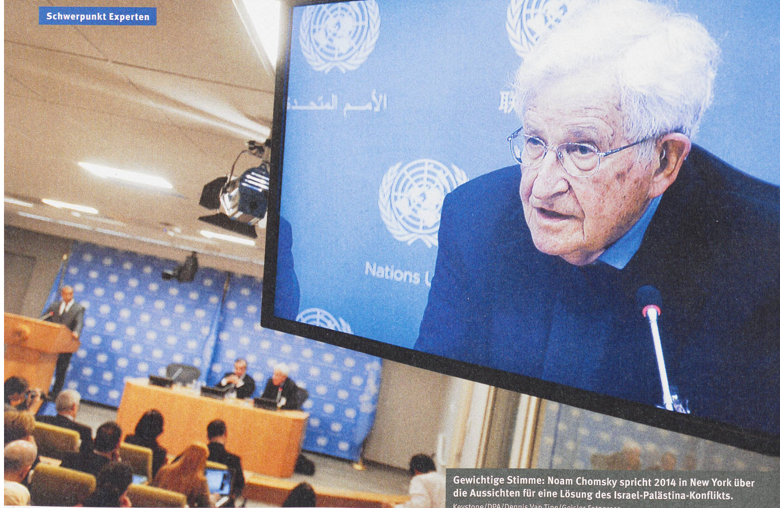
Gewichtige Stimme: Noam Chomsky spricht 2014 in New York über die Aussichten für eine Lösung des Israel-Palästina-Konflikts.