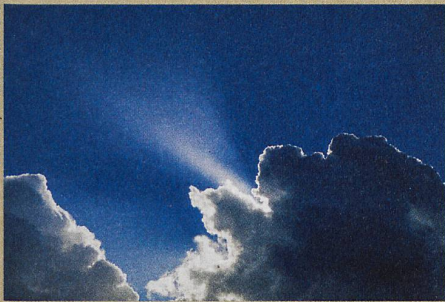
Ist ein Teil der Zelle in der Sonne und ein Teil im Schatten, entstehen Spannungsunterschiede.