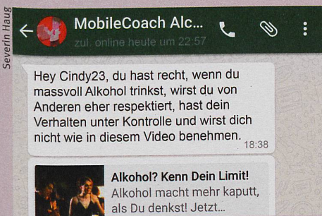
Das Programm erreicht Teenager per SMS dort, wo sie Alkohol trinken: abends an der Party.

S. Haug et al.: Efficacy of a Web- and Text Messaging-Based Intervention to Reduce Problem Drinking in Adolescents: Results of a Cluster-Randomized Controlled Trial. Journal of Consulting and Clinical Psychology (2016)