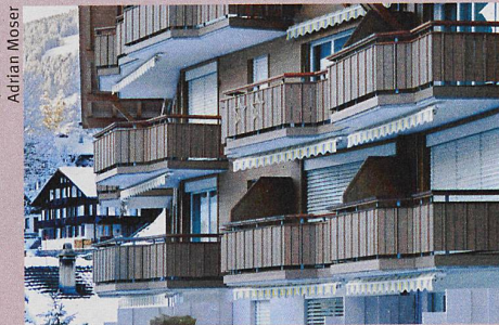
Die Initiative gegen kalte Betten wirkt unerwartet: Erstwohnungen haben an Wert verloren.