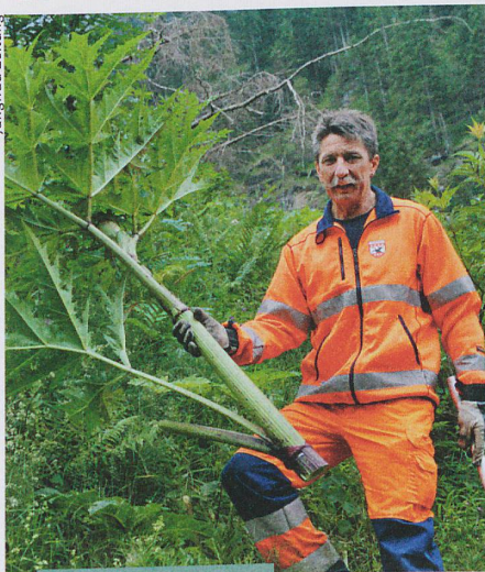
Biologie und Medizin