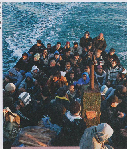
Kultur und Gesellschaft