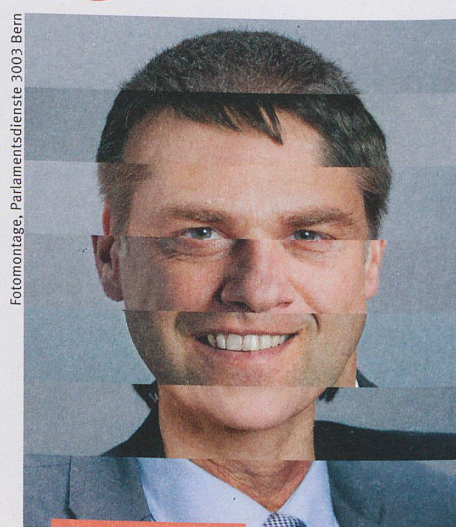
Fotomontage, Parlamentsdienste 3003 Bern