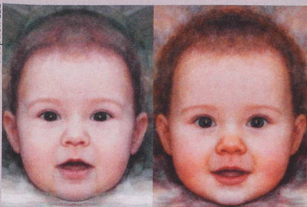
Kleiner, aber bedeutender Unterschied: Das Baby rechts erzeugt den grösseren Jö-Effekt.