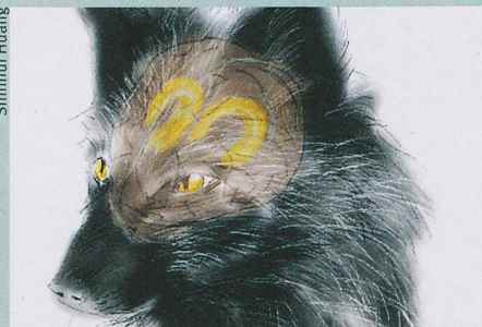
Stress wird nicht nur bei Füchsen im Hippocampus geregelt.