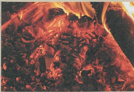
Selbst kleinste Rückstände von verbranntem Holz sind aufschlussreich.