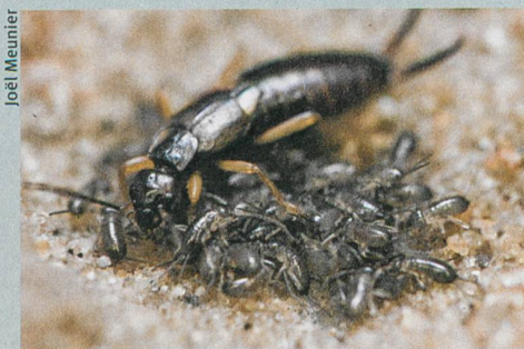
Ein Ohrwurmweibchen pflegt seine Jungen.

J.W.Y. Wong, C. Lucas & M. Kölliker (2014): Cues of Maternal Condition Influence Offspring Selfishness. PLoS ONE 9: e87214.