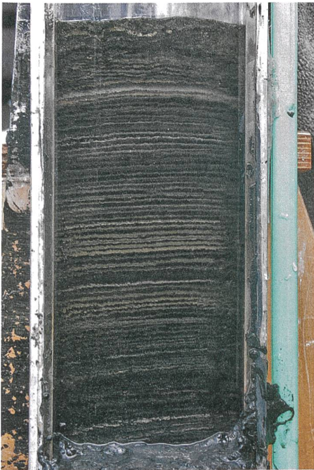
Bohrkern aus dem Seegrund des Greifensees. Jedes Jahr wird eine helle und eine dunkle Sedimentschicht abgelagert.

W asserflöhe zählen mit ein bis zwei Millimeter Körperlänge zu den eher kleinen Bewohnern der Seen. Dennoch gehören sie zu den wichtigsten. Milliarden von ihnen schwimmen durch die Seen und bilden die Hauptnahrung für Jungfische. Nun haben Forscher bei den Wasserflöhen etwas Beunruhigendes entdeckt: Ihre genetische Vielfalt hat sich in den letzten hundert Jahren grundlegend verändert. Schuld daran ist der Mensch.