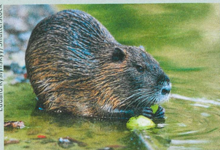
Auch die Bisamratte ist unerwünscht.

Tim M. Blackburn et al. (2014): A Unified Classification of Alien Species Based on the Magnitude of their Environmental Impacts. PLoS Biology 12: e1001850.