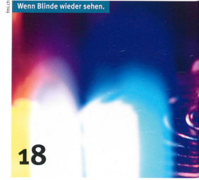
Wenn Blinde wieder sehen.