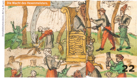
Die Macht des Hexenmeisters.