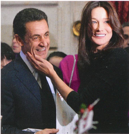
Narzissmus inklusive: Nicolas Sarkozy, Carla Bruni-Sarkozy (2009).